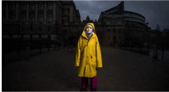
Greta Thunberg, activista sueca medioambiental de 16 años, junto al parlamento sueco, en Estocolmo. SAMUEL SANCHEZ