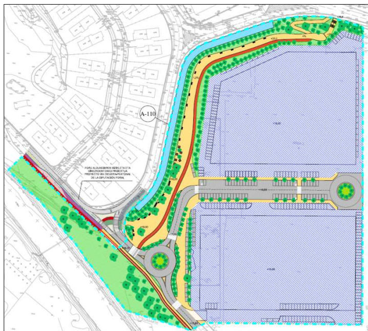
Plano ilustrativo de la ordenación del área A-110 Zapategi

Tal y como se ha recogido en el apartado anterior, el documento señala que el alcance de la modificación se circunscribe exclusivamente al trazado de unas nuevas alineaciones para los edificios privativos proyectados, y que se mantienen el resto de los condicionantes referidos a las condiciones de inundabilidad y actuaciones en el Dominio Público Hidráulico.