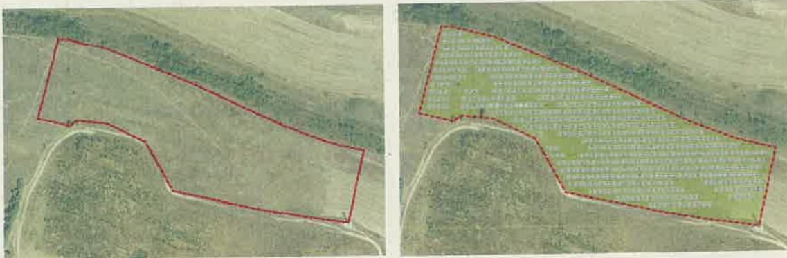
-Ubicación de la instalación propuesta-

Analizada la documentación disponible se comprueba que el proyecto se corresponde con una instalación fotovoltaica a cargo de Arabako Lautadako Ekiola S.Coop. sobre la parcela catastral 714 del polígono 1 del municipio de Agurain, la parcela carece de actividad agroganadera, según el SIGPAC la zona del proyecto la califica como pasto arbustivo y el PTS Agroforestal los clasifica como "Forestal, monte ralo".