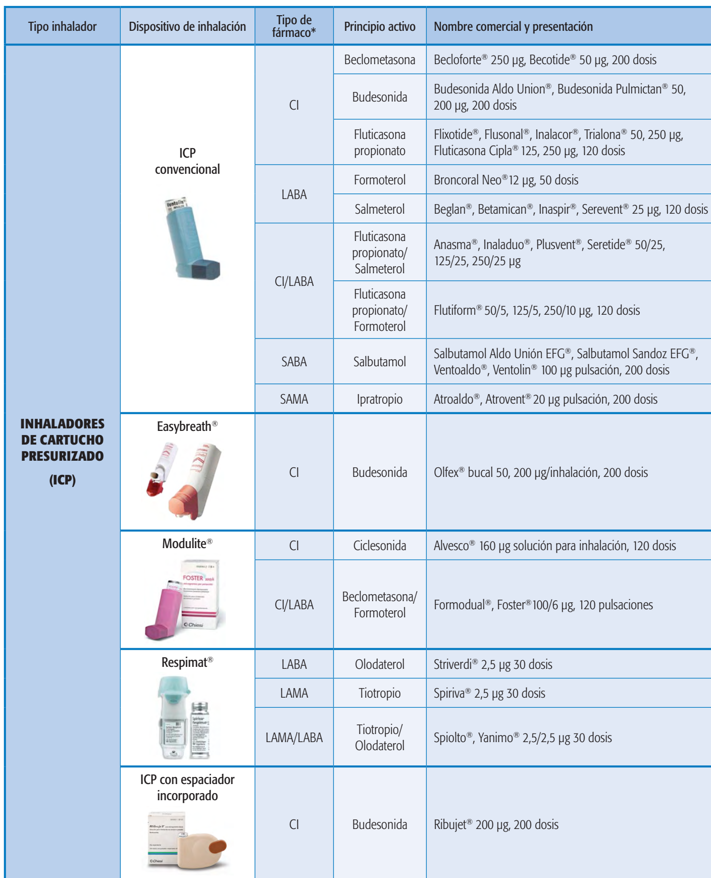
TABLA DE PRINCIPIOS ACTIVOS Y DISPOSITIVOS DE INHALACIÓN COMERCIALIZADOS 3 (mayo 2016)