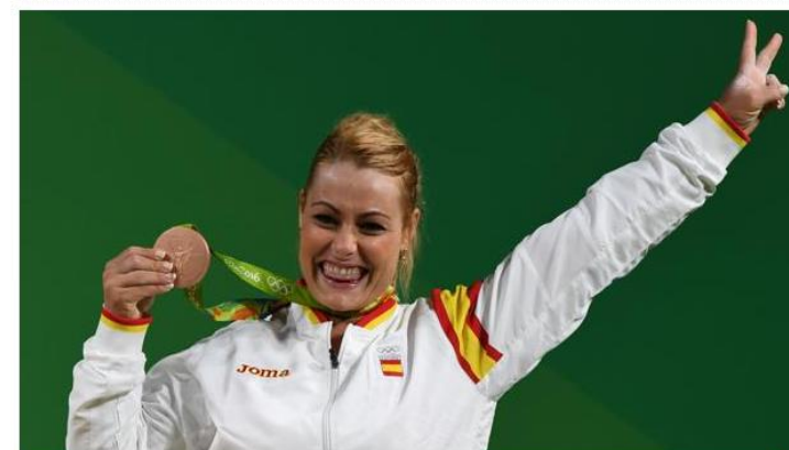
Lydia Valentín