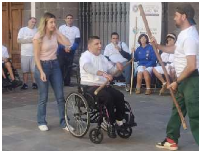
Lucha del Garrote Adaptado