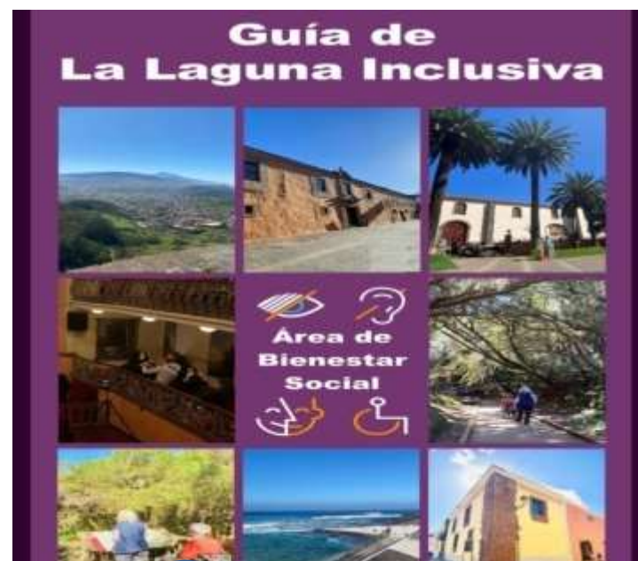
Guía de La Laguna Inclusiva