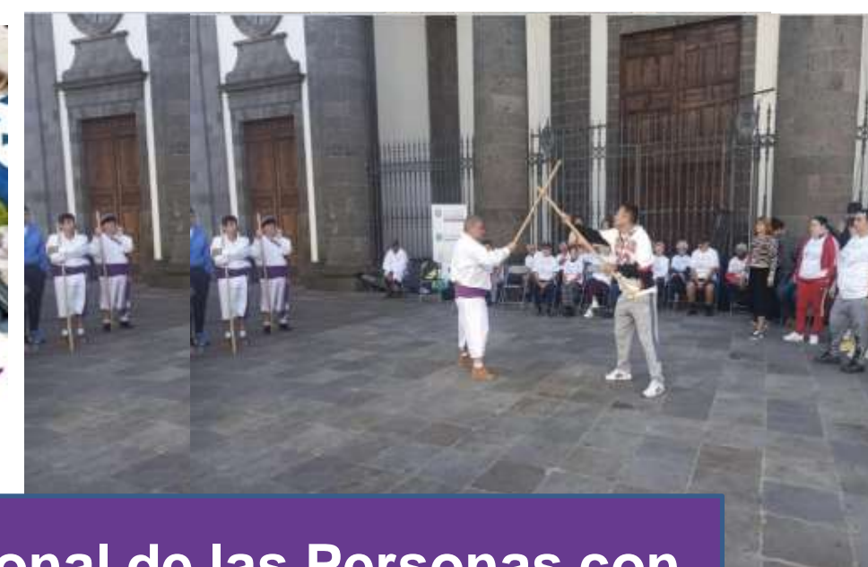
Día Internacional de las Personas con discapacidad