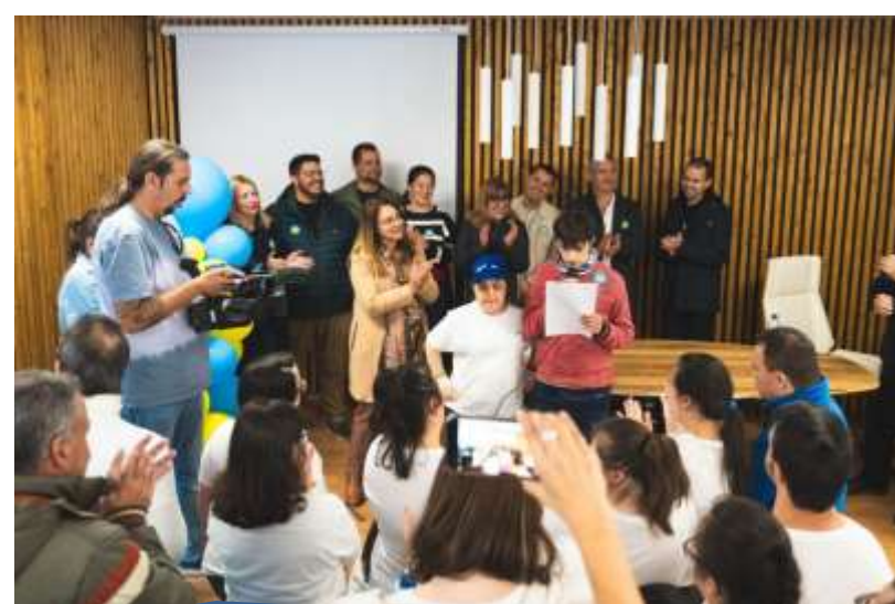
Día Internacional de las Personas con Síndrome de Down