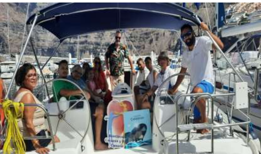
Proyecto Calderón: excursiones inclusivas de avistamiento de cetáceos