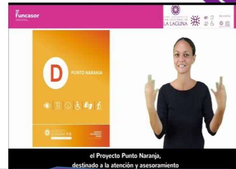
Servicio de intérprete de lengua de signos