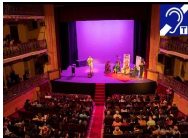
Bucles magnéticos en edificios públicos y eventos al aire libre