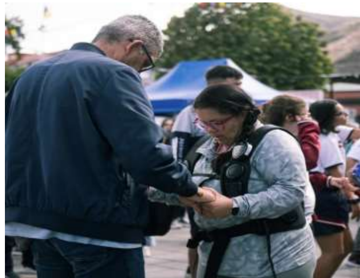
Servicio de mochilas sensitivas