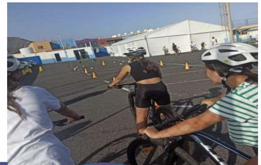
Talleres de bicicletas "Pedaleando hacia el futuro"