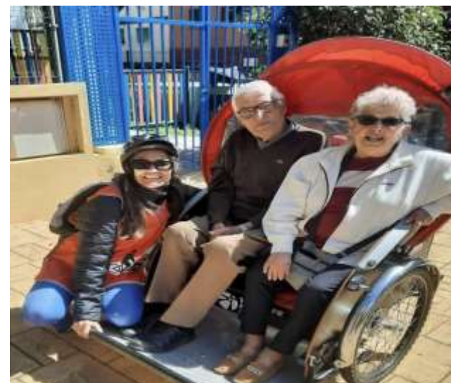
Bicis para todos y todas