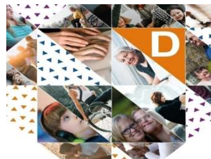
SIENTE, VIVE LA DISCAPACIDAD 2 DE DICIEMBRE. PLAZA DE LA CATEDRAL LA LAGUNA. 11:00H A 13:00H