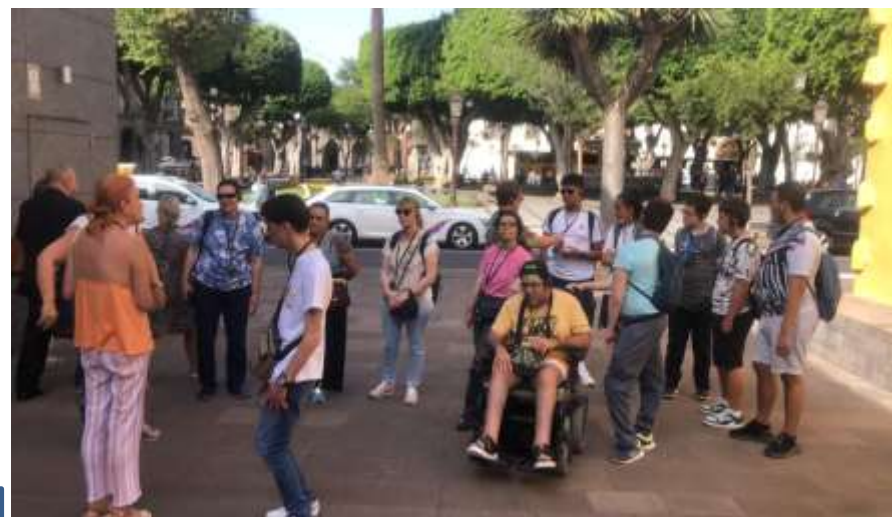
Servicio de rutas inclusivas Sintiendo mi ciudad