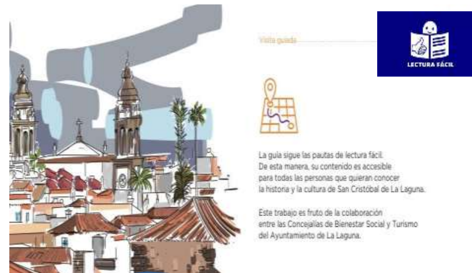
Material promocional en lectura fácil