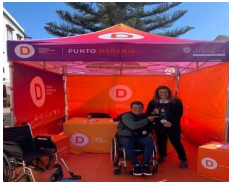
Servicio del Punto Naranja