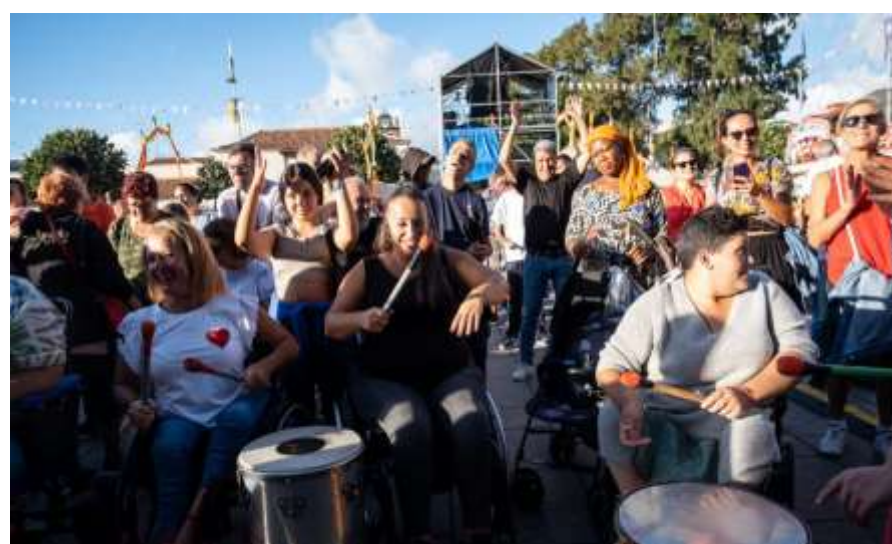
Conmemoración del Día Internacional de la Mujer