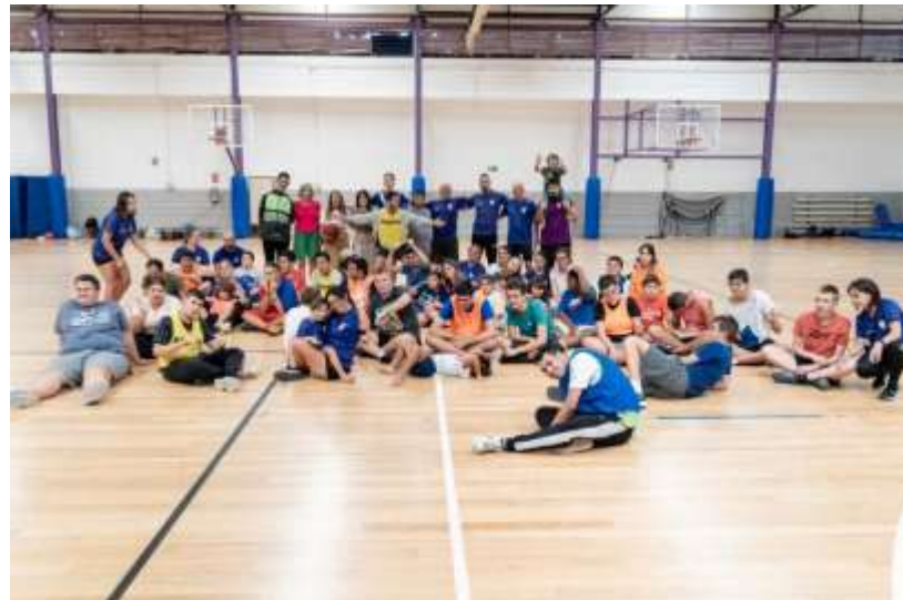
Campus multideporte inclusivo