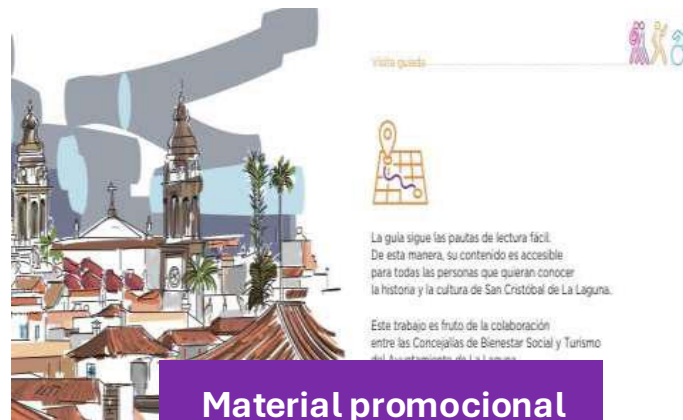
Material promocional en lectura fácil