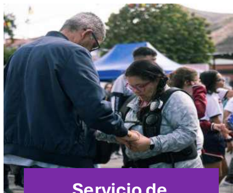
Servicio de mochilas sensitivas