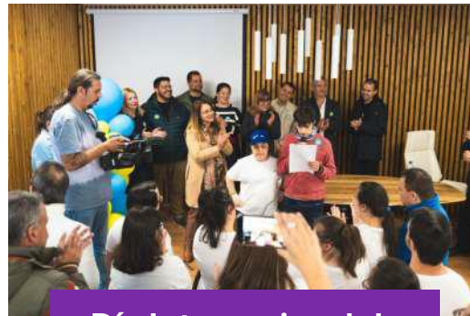
Día Internacional de las Personas con Síndrome de Down