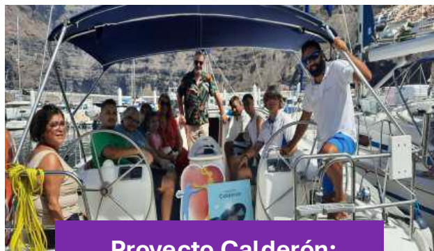
Proyecto Calderón: Excursiones inclusivas de avistamiento de cetáceos