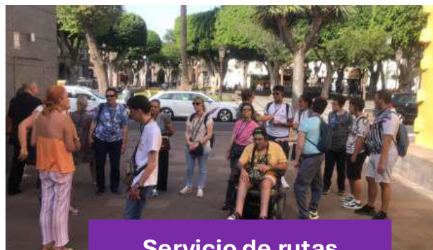
Servicio de rutas inclusivas Sintiendo mi ciudad