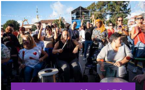
Conmemoración del Día Internacional de la Mujer