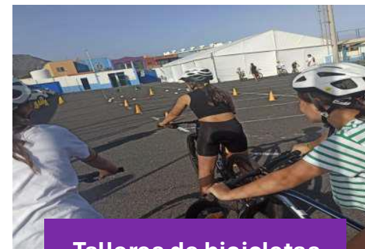
Talleres de bicicletas “Pedaleando hacia el futuro”