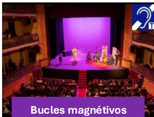
Bucles magnéticos en edificios públicos y eventos al aire libre