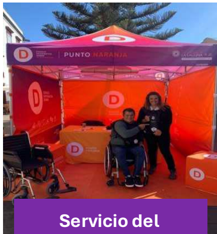
Servicio del Punto Naranja