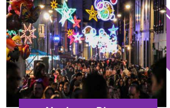
Noche en Blanco