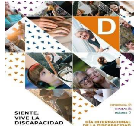
Día Internacional de las Personas con Discapacidad