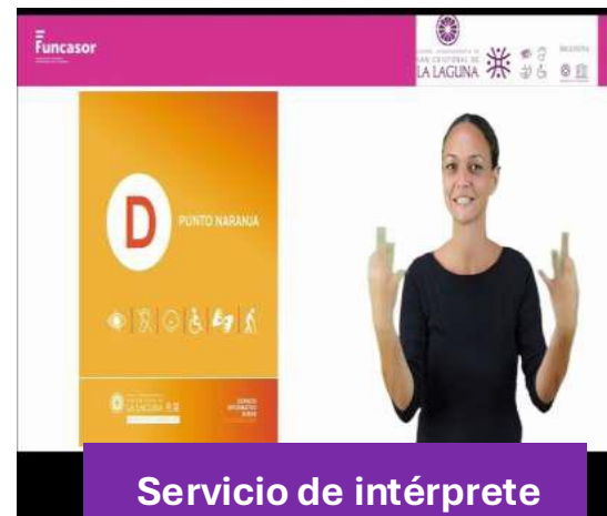
Servicio de intérprete de lengua de signos