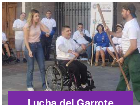
Lucha del Garrote Adaptado