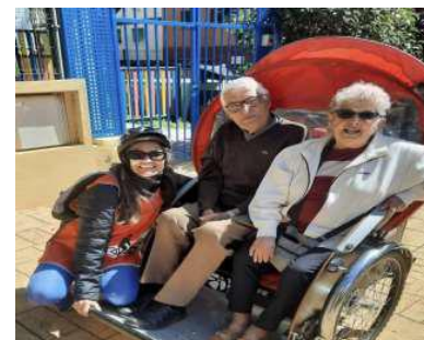
Bicis para todos y todas