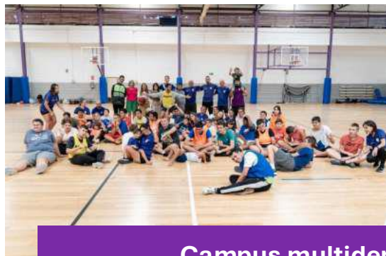
Campus multideporte inclusivo