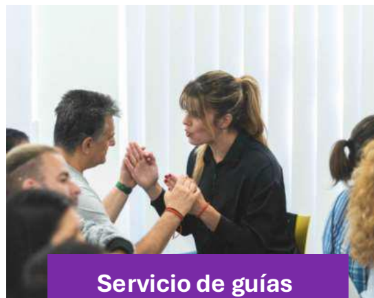
Servicio de guías intérpretes para personas sordociegas