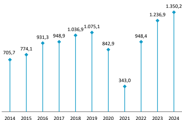
Hoteletan igarotako gaualdiak Urte bakoitzeko lehen hiruhilekoa. Milakoak