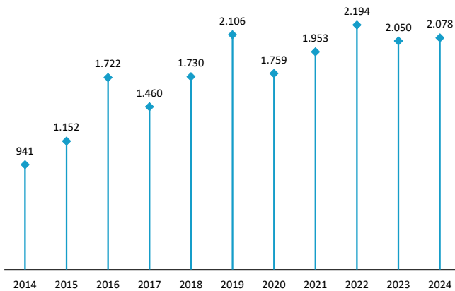
EAEn saldutako etxebizitzak Urte bakoitzeko otsaila