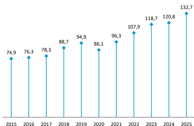
Producción de la construcción Tercer trimestre de cada año. Índice