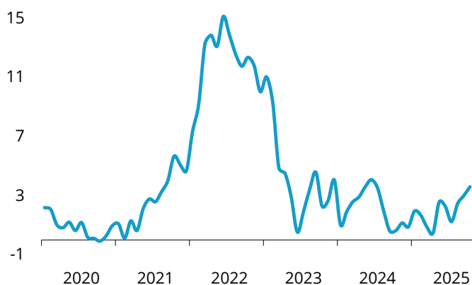
Índice de costes de la construcción Tasa de variación interanual