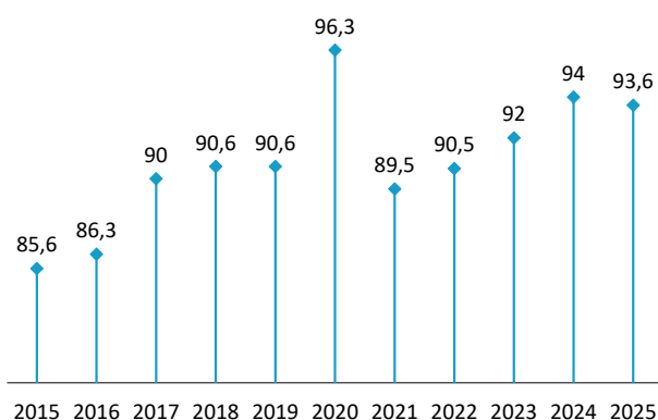
Ventas en grandes superficies Mes de agosto de cada año. Índice