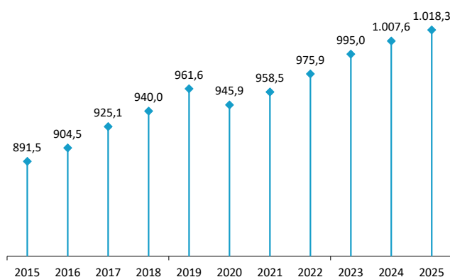
Afiliación a la Seguridad social Mes de septiembre de cada año. Miles