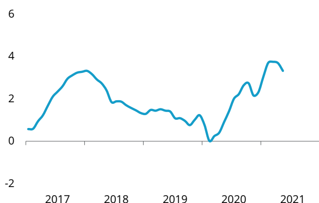
Venta en grandes superficies Tasa anual suavizada

La venta en grandes superficies y cadenas de alimentación registró en mayo un incremento interanual del 5,8%. Ese resultado se consigue con un descenso en la venta de alimentación del 6,7% pero con una subida en el resto de productos del 51,0%.