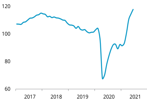
Sentimiento económico de la eurozona Índice

El sentimiento económico de la zona del euro se situó en junio en los 117,9 puntos . Ese valor indica un alto nivel de optimismo en el conjunto de la economía. Además, hay que reseñar que es el segundo mejor dato de toda la serie histórica, tras los 118,2 que se registraron en mayo de 2000.