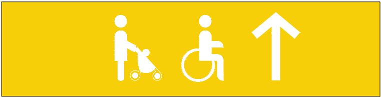
Pd Pictograma en vagón de tren para indicar vagón con espacio dedicado para personas minusválidas y coches de niños/as.