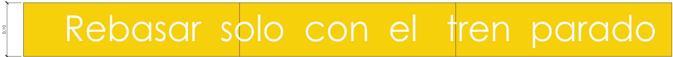
Ps (Psa y Psb) Aviso en borde de andén en dos idiomas (Euskera y Castellano)