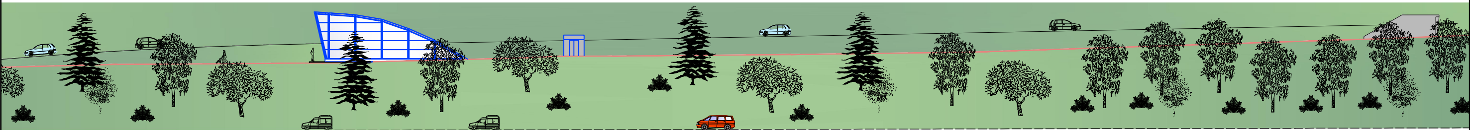
ALZADO . VISTA DESDE N-634