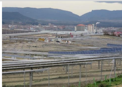
Ekain eguzki parke futboltaikoa