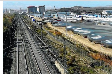
Plataforma logistikoko trenbide-sarea