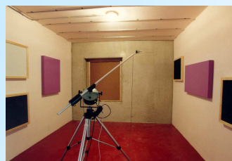
Ventanas / Paneles / Vidrios