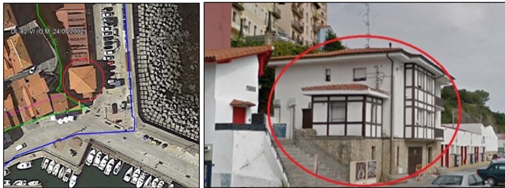
Ortofoto y foto oblicua de la edificación con posible uso residencial