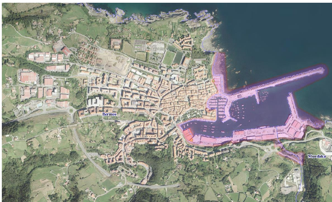
1. irudia. Bermeoko udalerrian azterketa-eremuaren (arrosa kolorea) xehetasuna.

Azterketaren eremua Bermeoko udalerrriaren ekialdean dago, hain zuzen, portuko gunean eta, aldi berean, Mundakako udalerriko ipar-ekialdeko gune bat hartzen du. Eremua bi udalerrietako portuko gunearekin bat dator.