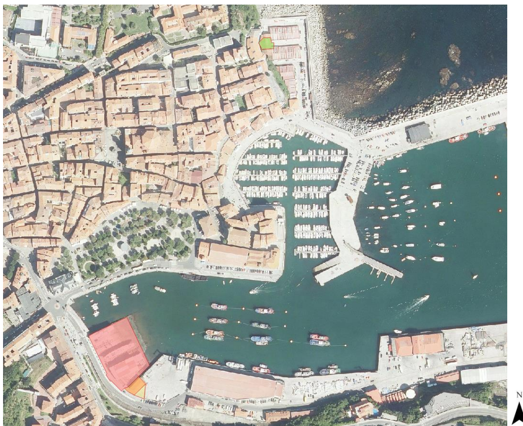
25. irudia. 2018an GeoEuskadiren ortoargazkia.

1956-1957 alditik 2018. urtera arte argazkiak azaldu dira.