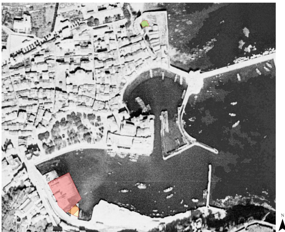
6. irudia. 1956-1957 aldiko GeoEuskadiren ortoargazkia. Aldi horretan lehenengoz azaldu zen Astilleros de Bermeoren jarduera GeoEuskadiren ortoargazkietan.

Ondoren, GeoEuskadi bisoretik atera ostean, ortoargazki-sekuentziaren zati bat bistaratzen da. Sekuentzian azkeneko hamarkadetan azterketa-eremuaren bilakaera antzeman daiteke.