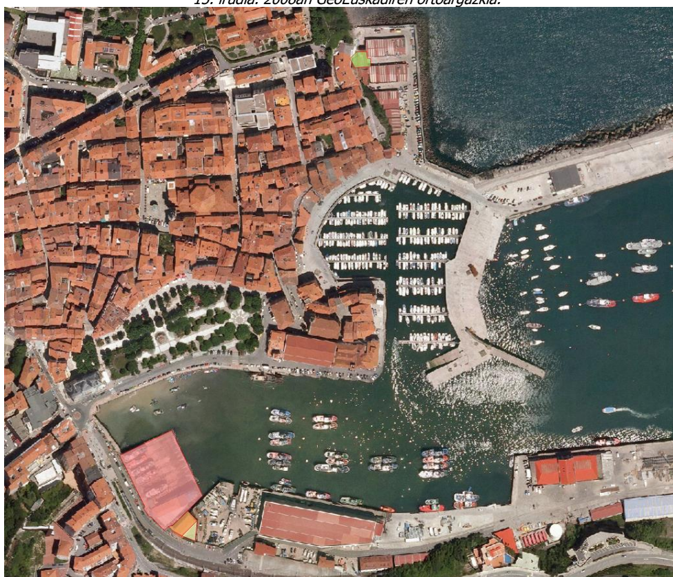
16. irudia. 2009an GeoEuskadiren ortoargazkia.