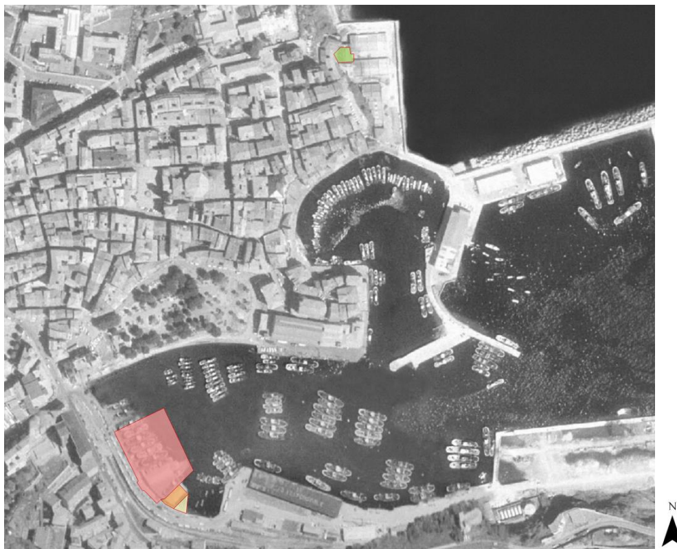
7. irudia. 1984 1985 aldian GeoEuskadiren ortoargazkia.