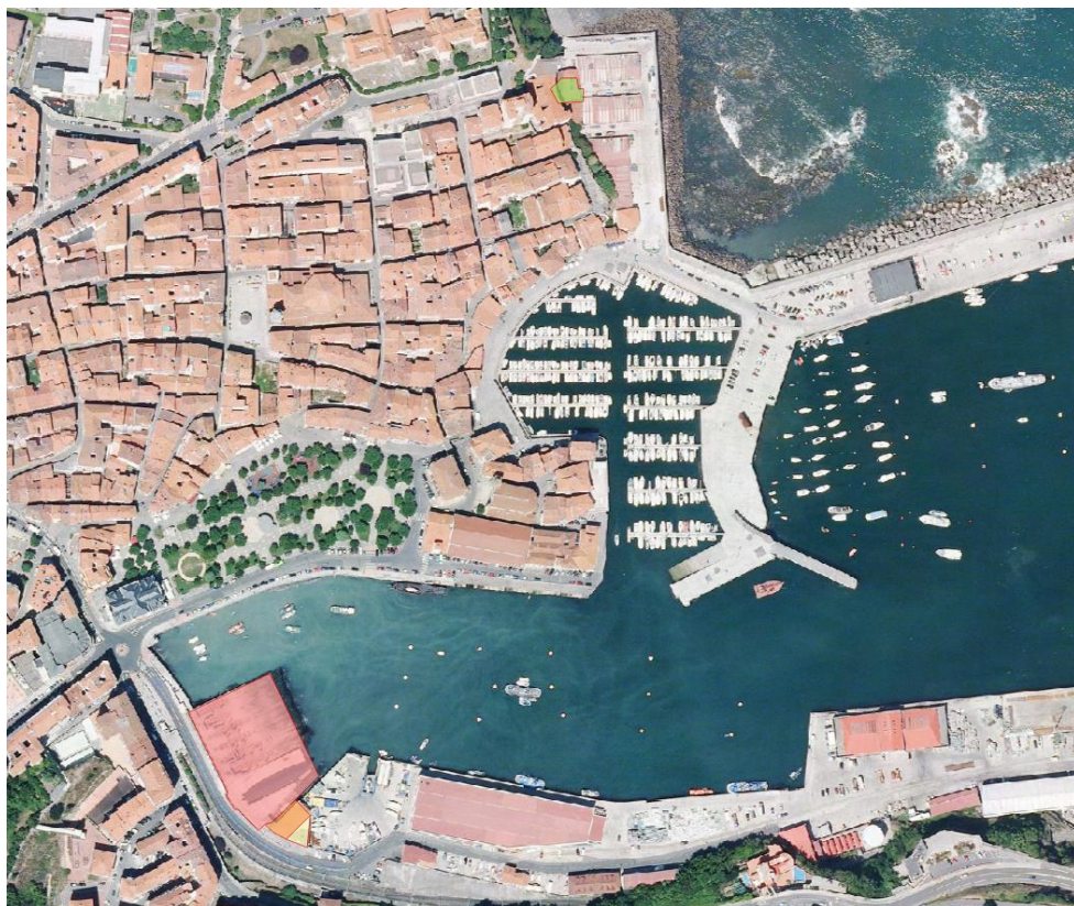
19. irudia. 2012an GeoEuskadiren ortoargazkia.