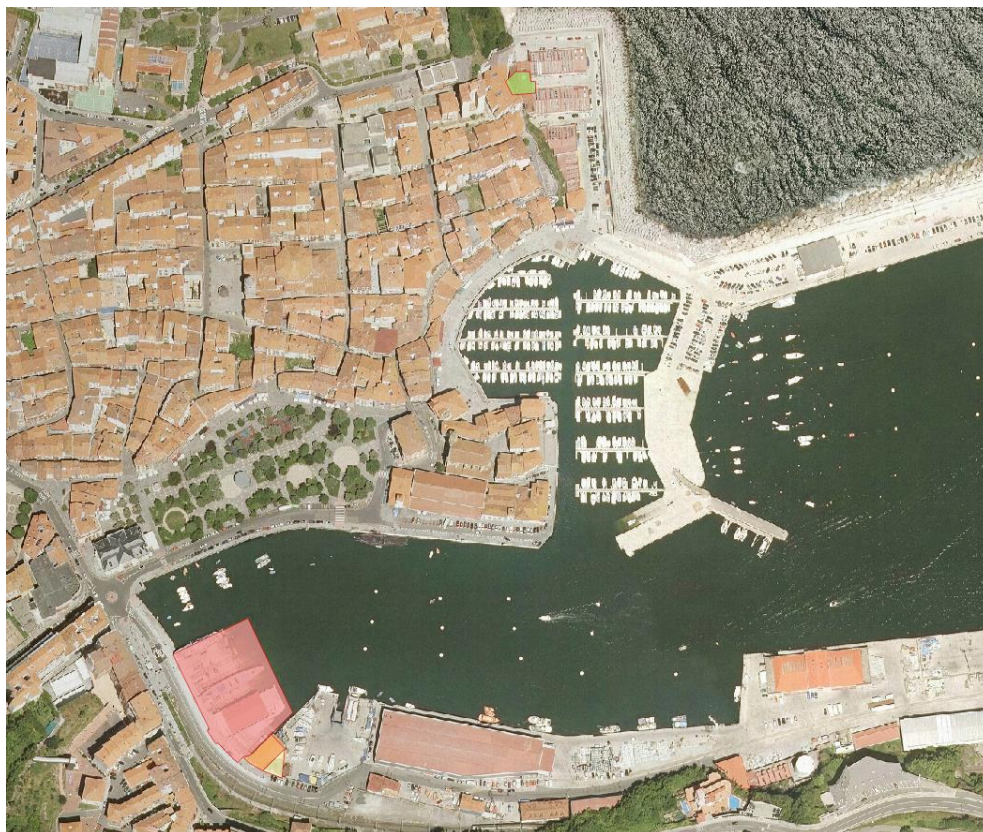
23. irudia. 2016an GeoEuskadiren ortoargazkia. Argazki honetan 48017-00035 lurzatian nabea dagoeneko zabaldua.