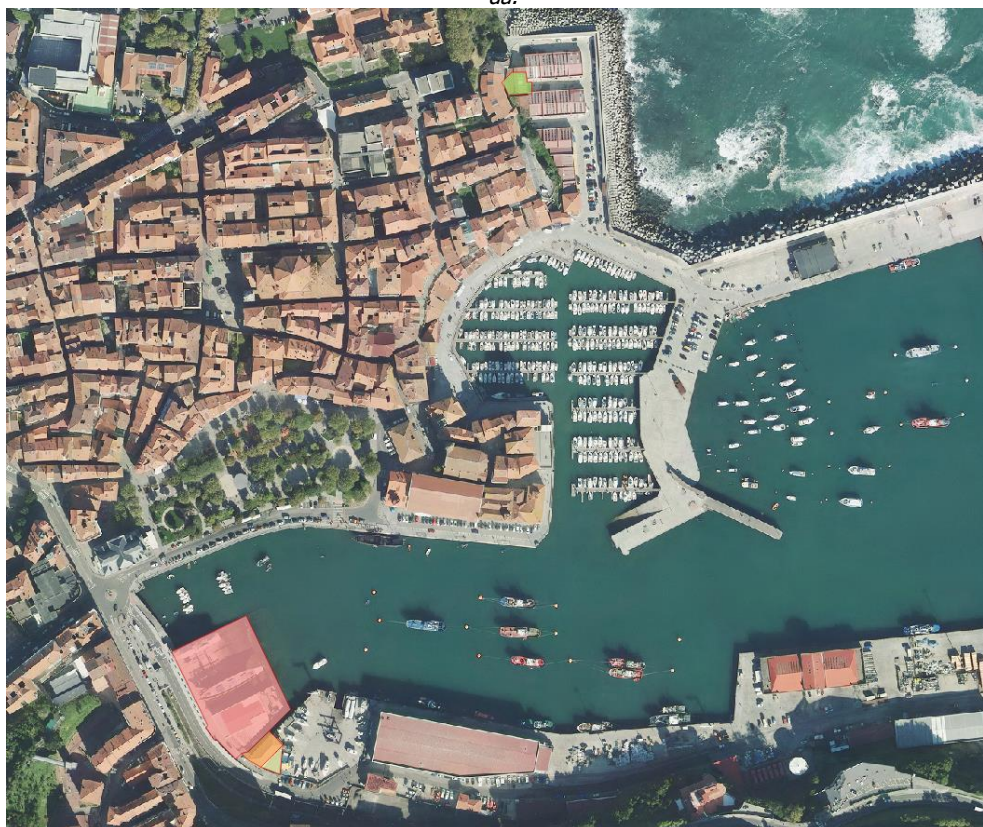
24. irudia. 2017an GeoEuskadiren ortoargazkia.