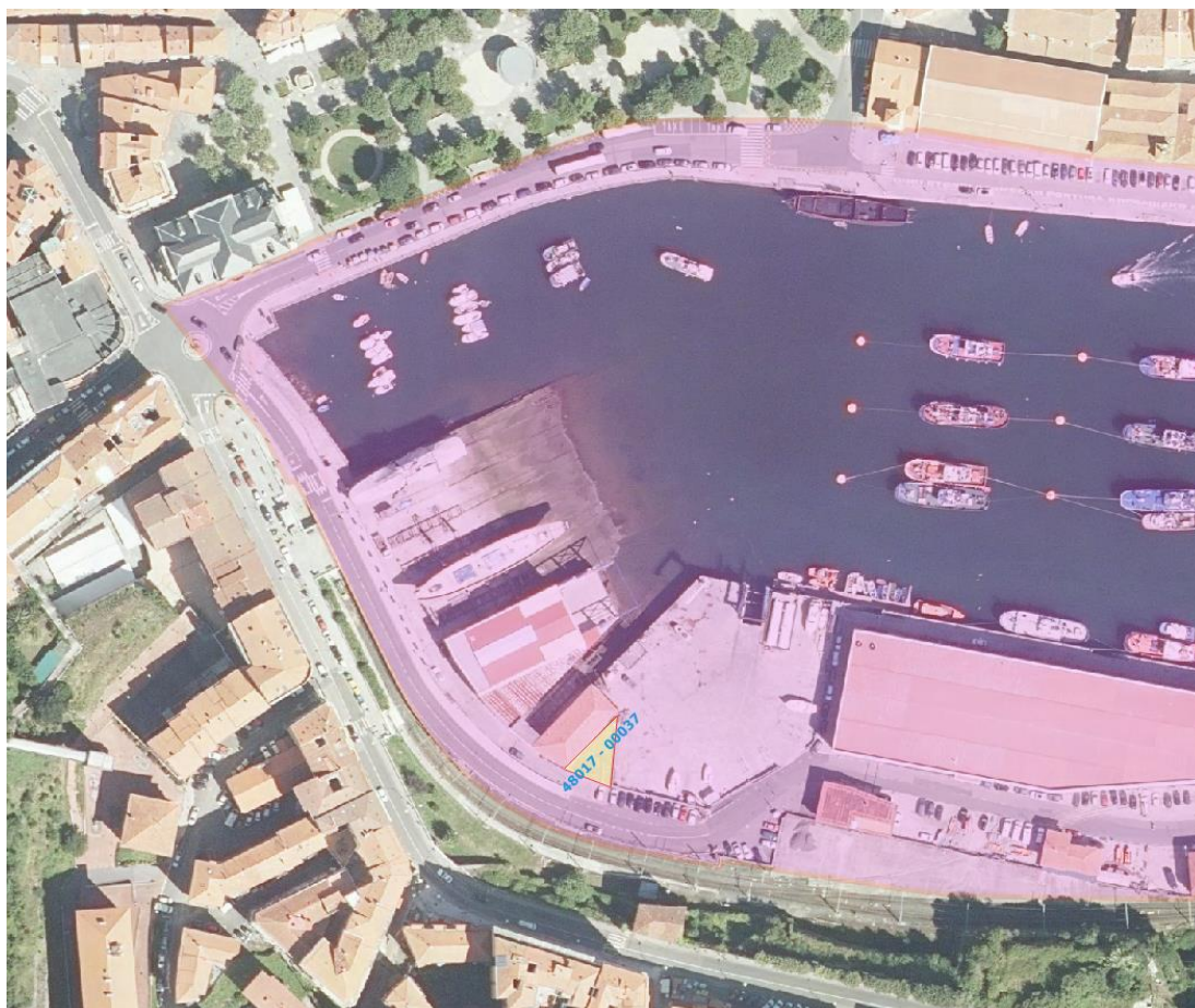
5. irudia. Azterketaren eremuan (arrosa) 48017 – 00037 lurzatiaren kokaguneari buruzko xehetasuna (horia).

Ingurumenarekiko eraginik ez da hauteman.