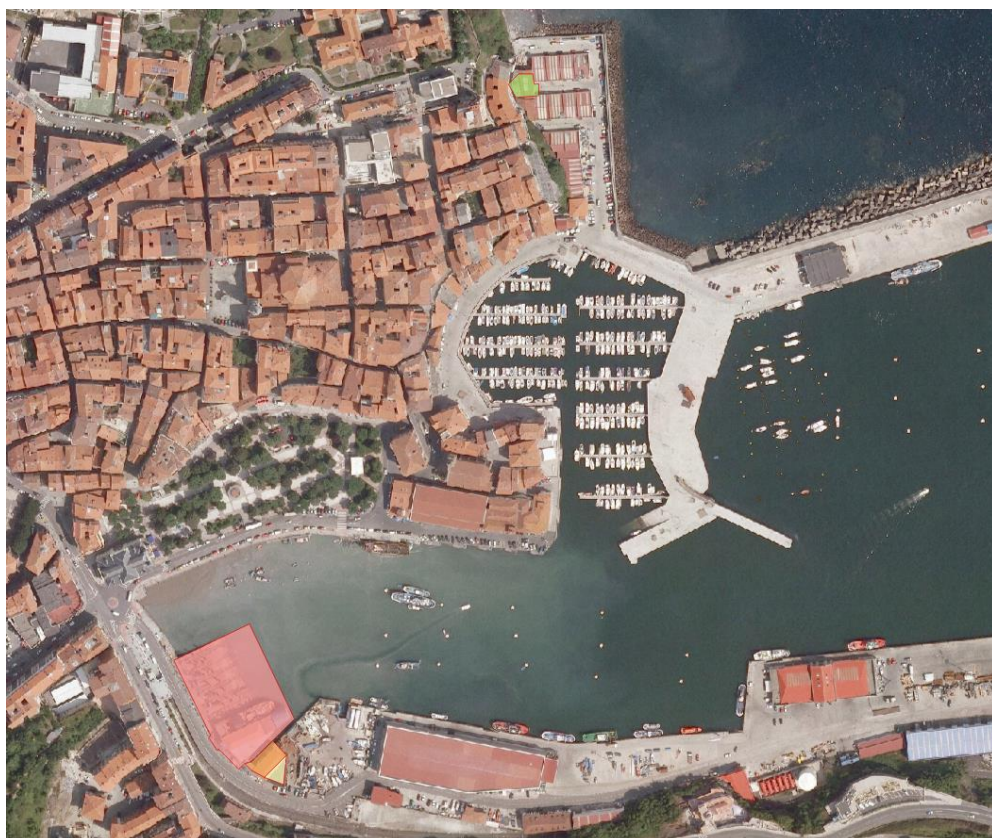
13. irudia. 2006an GeoEuskadiren ortoargazkia.