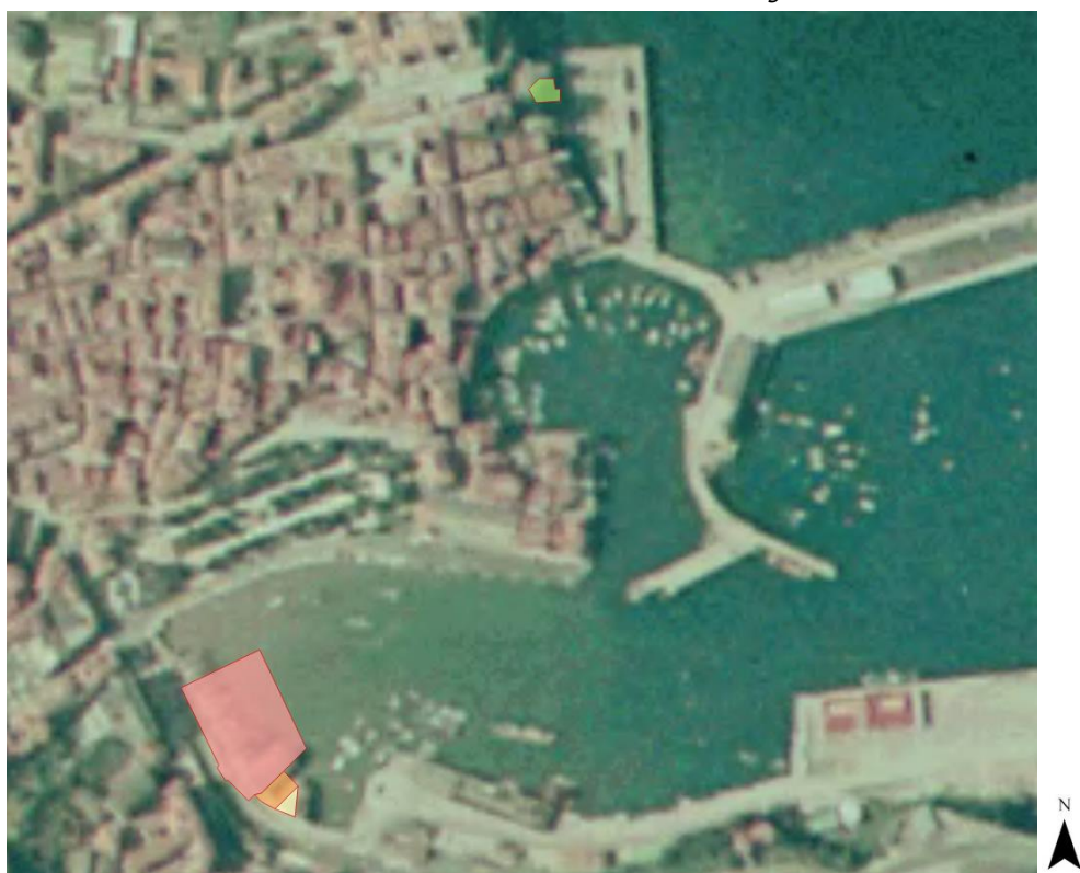
8. irudia. 1991ko GeoEuskadiren ortoargazkia. Argazkian ikusitakoaren arabera, azterketa-lurzatien ondoko gunea nabarmenki zabaldu da.