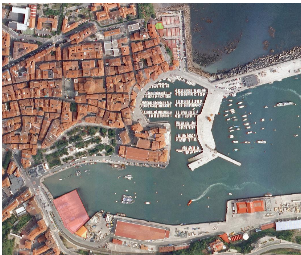
15. irudia. 2008an GeoEuskadiren ortoargazkia.