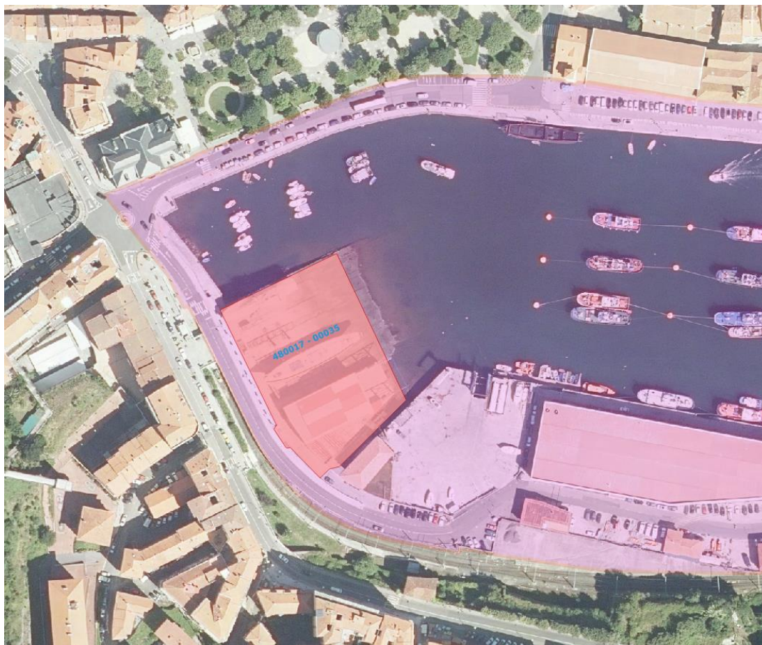
3. irudia. Azterketaren eremuan (arrosa) 48017 – 00035 lurzatiaren kokaguneari buruzko xehetasuna (gorria).