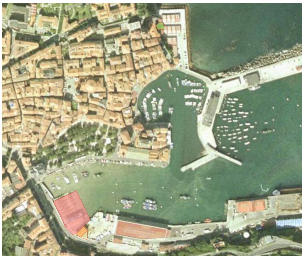
9. irudia. 2001ean GeoEuskadiren ortoargazkia.