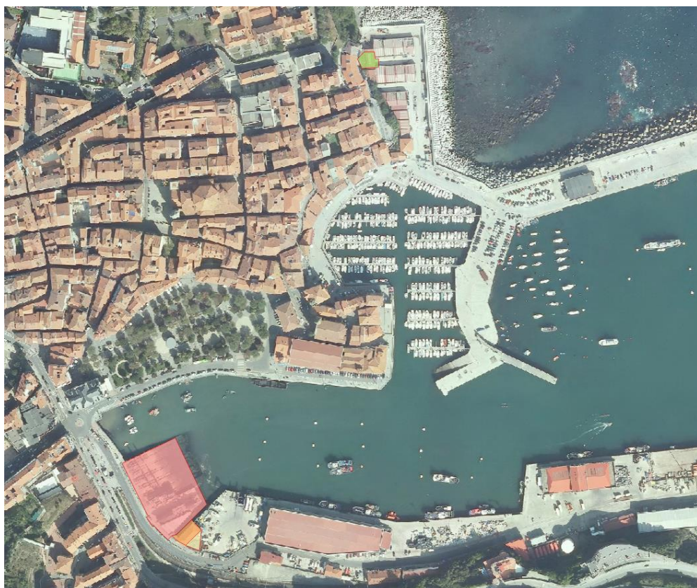
21. irudia. 2014an GeoEuskadiren ortoargazkia.