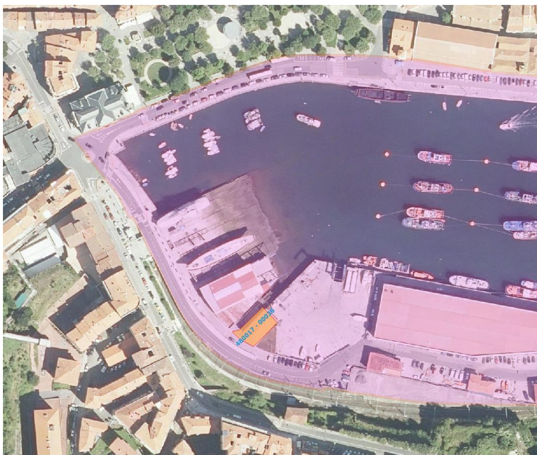
4. irudia. Azterketaren eremuan (arrosa) 48017 – 00036 lurzatiaren kokaguneari buruzko xehetasuna (laranja).

Kokagunea Okaren arroan aurkitu daiteke, Bermeoko hirigunetik gutxi gorabehera 100 metrora. Kokagunean ingurumenarekiko eraginik ez dago.