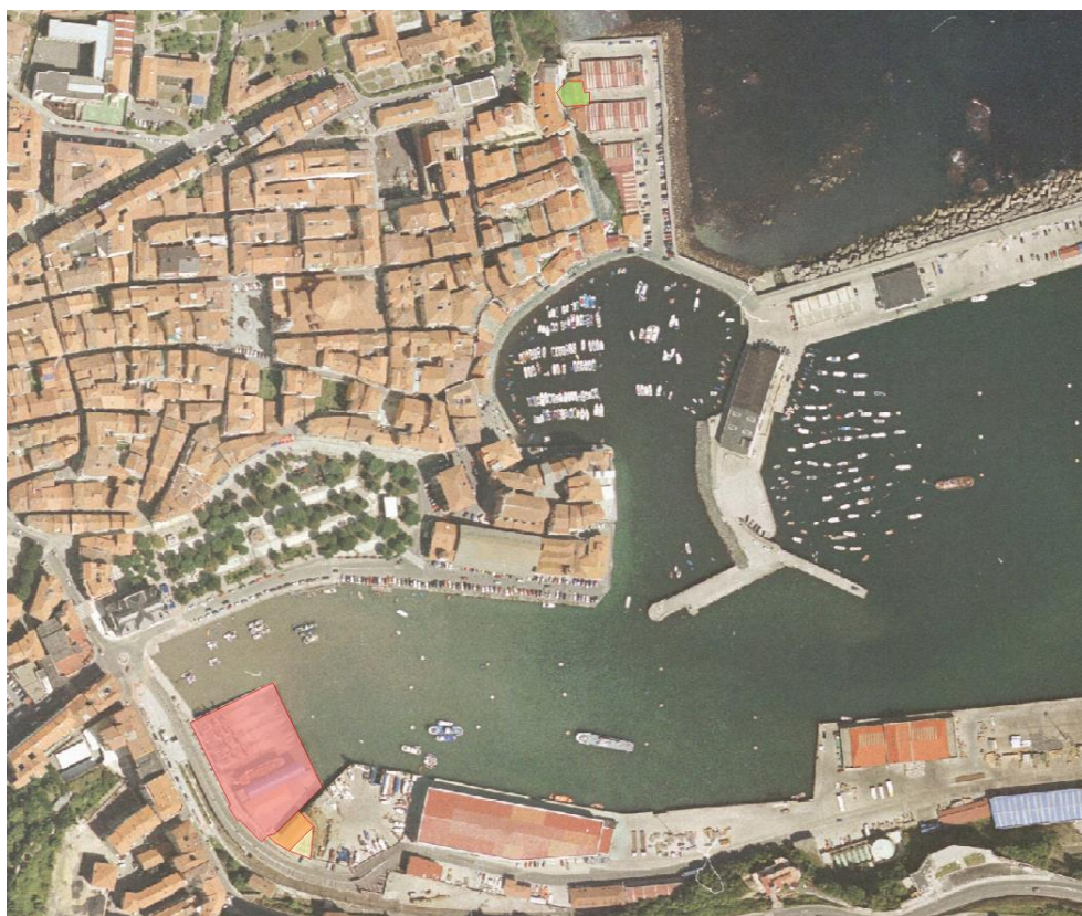
11. irudia. 2004an GeoEuskadiren ortoargazkia.