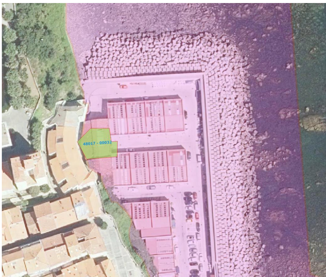
2. irudia. Azterketaren eremuan (arrosa) 48017 – 00032 lurzatiaren kokaguneari buruzko xehetasuna (berdea).

Lurzatiak hiri-lurzoruaren hirigintza-sailkapena du eta industria-erabilera egiten da. Ez da ingurunearekiko eraginik antzeman eta sortutako ikuste-eragina txikitzat jo da.