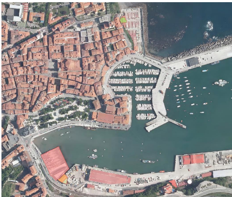
17. irudia. 2010ean GeoEuskadiren ortoargazkia.