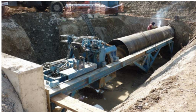
Soldadura de la tubería.

Suele ser de acero común al carbono, en tramos de longitud 3 ó 6 m. los espesores habituales suelen estar entre 4 y 8 mm, en función del diámetro y cargas previsibles. La soldadura interna de cada tramo puede ser de virola, helicoidal o longitudinal. En obra se suelda cada tramo con el consecutivo, debiendo cuidarse la correcta alineación, sobre todo en el primer tramo.