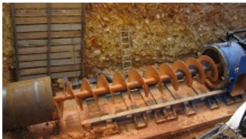
Desmontaje de las hélices una vez finalizada la perforación.

El acoplamiento entre segmentos sucesivos es mediante un enchufe hexagonal y un bulón (porque también trabajan a tracción), cuya capacidad de soportar par irá de acuerdo con el diámetro de la perforación.