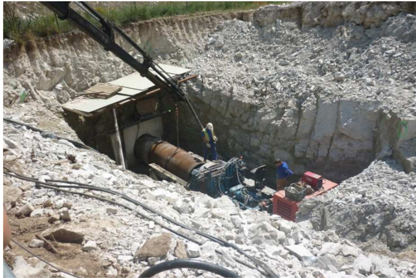
Foso de ataque.

Salida: 2 m o menos, en función de la comodidad para conectar con el conjunto de la obra. A veces se usa para recuperar el cabezal perforador. El ancho requerido depende de las dimensiones del equipo empleado y de circunstancias locales, p.ej. que se pueda colocar el grupo motogenerador junto al pozo o haya que bajarlo al mismo. Suele estar entre 3 y 4 m.