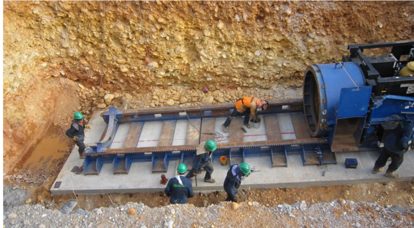
Montaje de la máquina.

Este sistema rotativo permite perforar en rocas de durezas de hasta 60 MPa, diámetros desde 400 mm hasta 1.400 mm y longitudes de hasta 100 m, dependiendo de las características de la máquina y del diámetro.