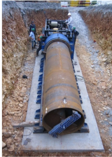
Cabeza de corte.

Otra característica fundamental es la incorporación, o no, de brazo extensible-retraíble, que permite dar un sobrecorte previniendo al mismo tiempo las sobreexcavaciones por derrumbe del techo, así como posibilitando la extracción completa de la sarta en caso de averías en el cabezal.