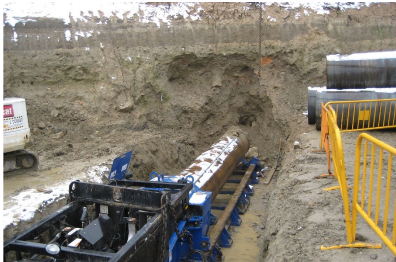
Tubería en bastidor de apoyo.

Como ya se indicó, la máquina está dotada de un motor-reductor hidráulico que da giro al conjunto cabeza-sinfín, y de dos mecanismos de empuje, uno para el tubo y otro para el conjunto cabeza-sinfín, permitiendo independizar el avance de cada uno en función de la naturaleza del terreno.