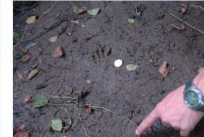
Huella de mapache. La Cadena, Karrantza Harana