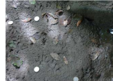
Huella de mapache. La Cadena, Karrantza Harana