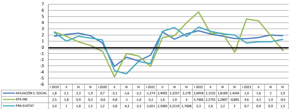
Gráfico nº 1. INDICADORES DE EVOLUCIÓN DEL EMPLEO EN LA CAPV: TASAS DE VARIACIÓN INTERANUAL (2019-2023)

Fuente: Elaboración con datos de EUSTAT, INE, y Seguridad Social.