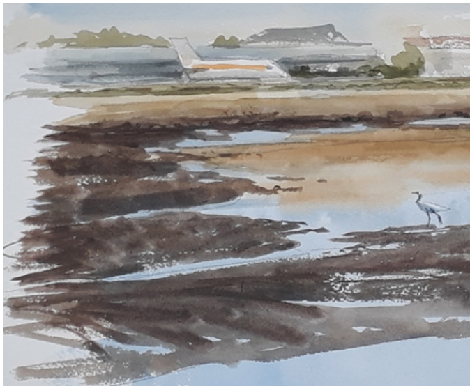
Ilustrazioa / Ilustración: XABIER MENDARTE