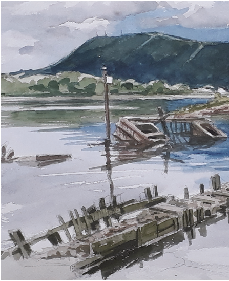
Ilustración: Xabier Mendarte

Imparte: Xabier Mendarte Lugar: Ekoetxea Txingudi Día: 24 de octubre Hora: 10:00-13:00 Idioma: castellano Actividad gratuita Inscripción necesaria: txingudi@euskadi.eus / 943 619 389