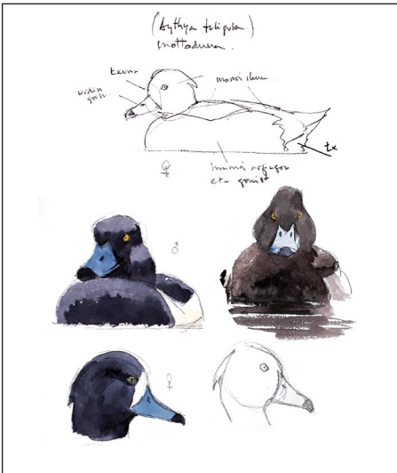
Ilustración: Xabier Mendarte

Imparte: Xabier Mendarte Lugar: Ekoetxea Txingudi Día: 21 de noviembre Hora: 10:00-13:00 Idioma: castellano Actividad gratuita Inscripción necesaria: txingudi@euskadi.eus / 943 619 389