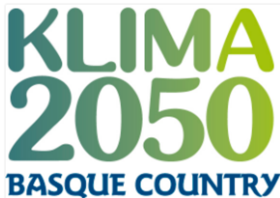
Estrategia vasca de cambio climático 2050