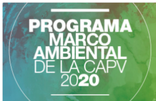
Programa marco ambiental