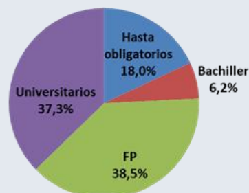
Nivel académico requerido

En lo referente a la evolución, comentar que en 2022 es mayor la cantidad de ofertas que especifican el nivel de estudios requerido (2.783 ofertas en 2022 frente a 2.164 en 2021), siendo el peso de estos sobre el total de ofertas registradas (el 18,8% de las ofertas) superior al 18,3% del año 2021. En la relación interanual, todas las ofertas han aumentado. Las ofertas de estudios de FP son las que más aumentan en términos absolutos, 279 ofertas más, 35,18% de aumento; en valores relativos, son las ofertas que requieren estudios universitarios los que más crecen con un 35,20% de aumento, 270 ofertas más.