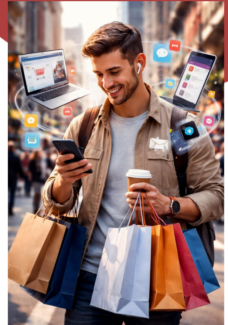
Imagen generada con Inteligencia Artificial

La clientela llega con una idea previa y a veces con una decisión tomada, ante esto la transparencia es obligatoria: precios, calidad, origen, es lo que el y la cliente desean comprobar.