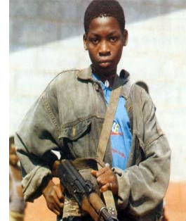
C. Niño soldado