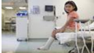
B. Niña en hospital