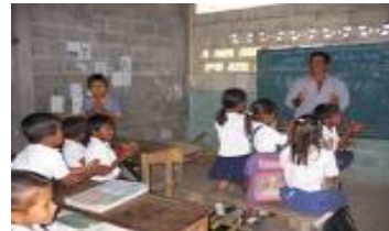
F. Niños en la escuela