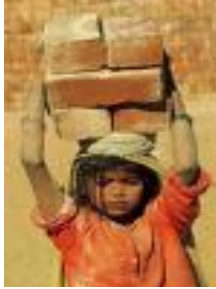
A. Niña trabajando

2. A continuación aparecen unas fotografías. En algunas se ve que se cumplen los derechos de los niños y las niñas, pero en otras no. Indica en cuáles SÍ se cumplen los derechos de los niños y las niñas.