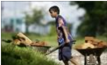
D. Niño trabajando