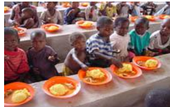
E. Niños comiendo en la escuela