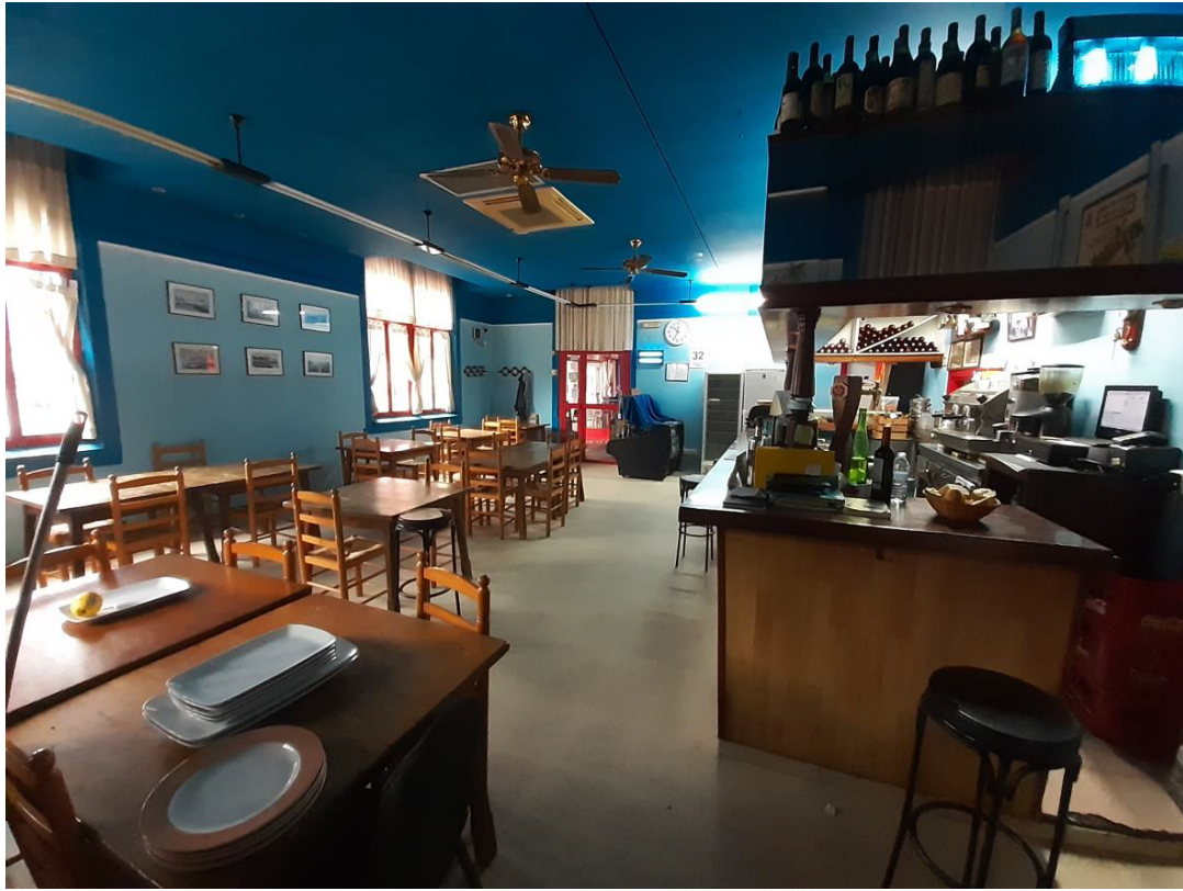
3. irudia_lokalaren barnealdea. Jatetxearen eta tabernako barraren egungo egoera.