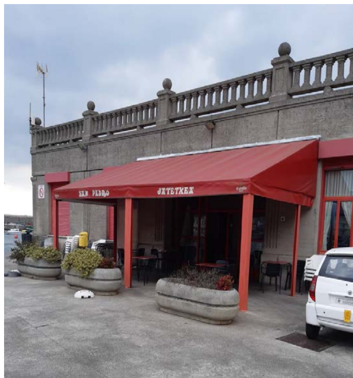
Imagen nº1_terraza exterior. Estado actual.