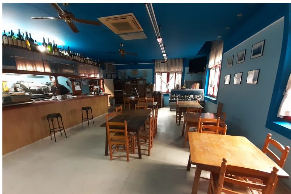
Imagen nº2_interior local. Estado actual comedor y barra del bar.