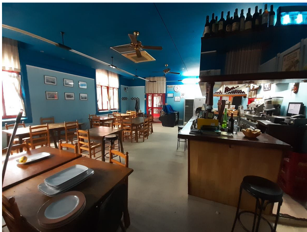
Imagen nº3_interior local. Estado actual comedor y barra del bar.