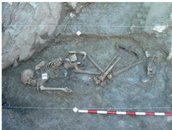
Gorpuak hobitik ateratzen - Elgeta

Ondoren, agiri tekniko hori gorpuzkien analisiaren txostenarekin osatuko da, gorpua identifikatu eta heriotza-kausak zehazteko. Hori guztia arloan espezializatutako laborategietan egingo da.