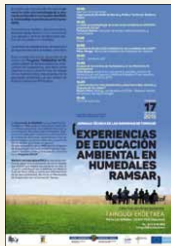
Flyer anunciador de la Jornada Técnica

Esta jornada técnica se desarrolló en el marco del Proyecto TXINBADIA 14/15 , como colofón de las actividades de Intercambio de Experiencias, en las que se conocieron otras formas de trabajo en las distintas áreas relacionadas con la Educación Ambiental y el uso público en Espacios Naturales Protegidos (ENP).