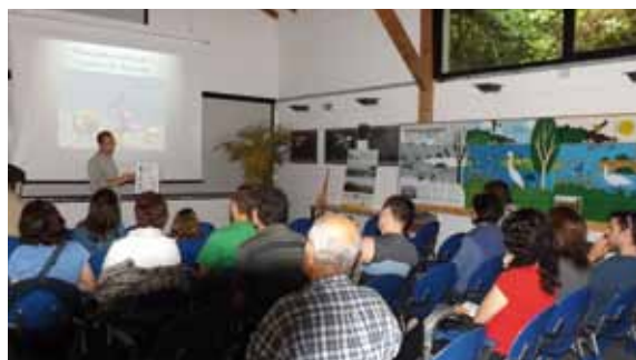
Txingudi Ekoetxearen egindako jardunaldi teknikoak

Espezie honekin, 22 espezie dira Txingudiko inguruetan aurkituriko espezieak . Esate baterako, ez da Txingudiko Badiaren inguruetan espezie berriren bat