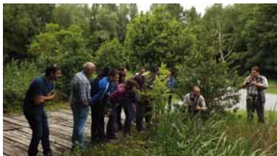
Hemendik gutxira, Txingudi Ekoetxearen ondoan, espezie berria izango dugu

aurkitzen ez den urterik. Iaz Trithemis annulata (Paillet de Beauvois, 1807) espezie ikusgarria izan bazen gure artera etorri zena, oraingo honetan Coenagrion generoko lehen aurkikuntza dugu Plaiandirako. Honen poz berezia ematen digu. Gainera, Interpretazio Zentroaren ondoan egokitu den putzuak beste Coenagrion Familiako beste espezie bat - Coenagrion puella (Linnaeus, 1758)- gure artean laster izango dela aurreratzen digu.