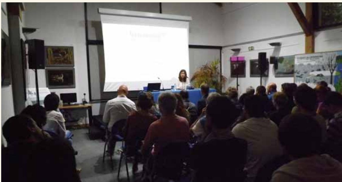
Imagen general de una de las conferencias ofrecidas en Txingudi Ekoetxea