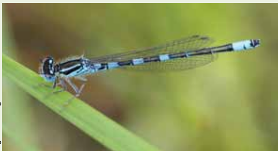
Coenagrion scitulum (Rambur, 1842)

baino ikusezinoak dira, ugalketa lanetan aurkitzen ez baditugu behintzat. Ar eta emearen arteko elkarketa luzea izaten da, estalketak bata bestearen atzetik ematen direlarik (bikotea desegin gabe). Portaera hau, arrek aurreko arren esperma emeen organismotik kentzeko edo erretiratzeko duten ezintasunagatik ematen dela dirudi. Ez ohiko arazoa da hau odonatuaren arrentzako, hauek estrategia ezberdinak erabiliz aurreko arren esperma emeen gorputzetik kentzeko ahala baitute (bere estaltze organoak dituzten iletxo batzuk isipu modura erabiliz edo berauen esperma kopuru handian isuriz emearen organismoaren barnerantz). Arrautzak jartzea bikotean ematen da eta bikoteek arrautzak jartzerakoan taldeak osa ditzakete. Eginkizun horretan arra tente mantentzen da emearen gainean, hau babestu eta defendatzen duen bitartean. Sarritan, populazioak handiak direnean, bikoteek taldean jartzen dituzte arrautzak, ikuskizun ahaztezina emanez.