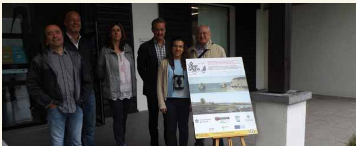
Ponentes de la Jornada Técnica en Txingudi Ekoetxea

La WLI es una red global de centros para la conservación de humedales coordinada por la organización Wildfowl & Wetlands Trust (WWT) , única organización benéfica del Reino Unido especializada en la conservación de humedales que cuenta con una red nacional de centros de visitas a humedales. La red WLI trabaja en estrecha colaboración con la Secretaría de Ramsar para respaldar la realización de su trabajo CECOP. WLI y la Convención Ramsar firmaron un Memorando de Cooperación en noviembre de 2005.