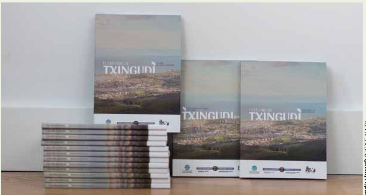
Liburutxoak, hiru hizkuntzetan argitaratu dira (euskaraz, gaztelez eta frantsesez)

63 orrialde dituen liburuxka honetan, Txingudiko estuarioaren sistema fisiko eta ekologiko paregabea eta bertako paisaia eraldatua azaltzen du testu zein argazki eta marrazki bidez. Eta bestalde, estuarioak, planetako ingurune oparoenetakoak izanik hauen kontserbazioa guztion onerako dela eta horrexegatik babestu behar direla defendatzen du.