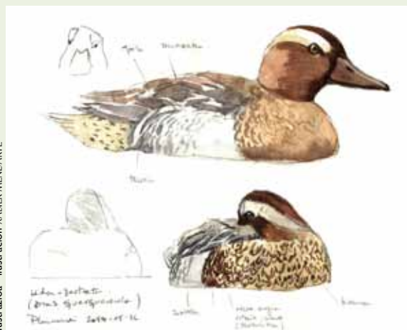
ilustrazioa • ilustración XABIER MENDARTE