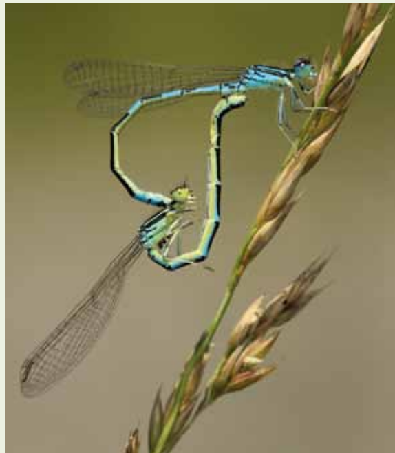
Ar eta emearen arteko elkarketa luzea izaten da, estalketak bata bestearen atzetik ematen direlako

Coenagrion generoko ar guztiak bezala, arra urdina da, diseinu beltzekin abdomeneko gainaldean (hirugarren segmentutik bosgarrenera erdia baino gehiago urdina da eta seigarrena eta zazpigarrena erabat beltzak) eta emea ere urdina da, nahiz eta abdomeneko zonalde batzuk berdexkak izan ditzaketen. Hegoetako pterostigmak argiak dira eta erronboide itxura dute.