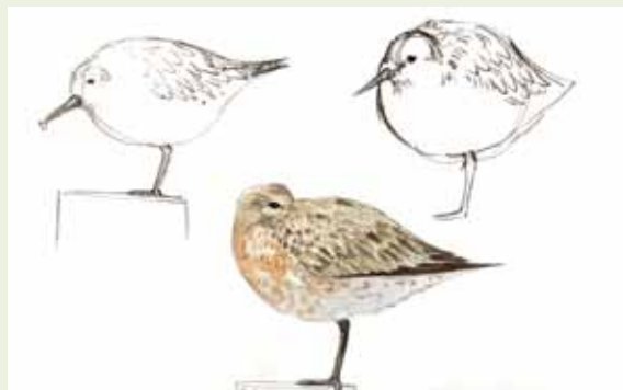
ilustrazioa • ilustración XABIER MENDARTE

Naturaz gozatzeko hainbat modu daude eta berau ikusi, interpretatu eta isladatzeko beste hainbat. Ezaguri guzti horiek betetzen dituen teknika bat bada, naturzaleen artean oso gustokoa dena, baina gutxik dakitena nola gauzatu. Natura marrazteko teknika da berau. Horrexegatik, Txingudiko Paduretatik, edozein naturzaleri teknika honetan trebatzeko aukera eman nahi zaio. Hori dela eta, Xabier Mendarte marrazkilarri trebe eta naturalistaren eskutik natura marrazteko (baitik-bat hegaztiak) oinarrizko argibideak emango dizkigun marrazketako hastapen ikastaroa izango dugu Txingudi Ekoetxean.