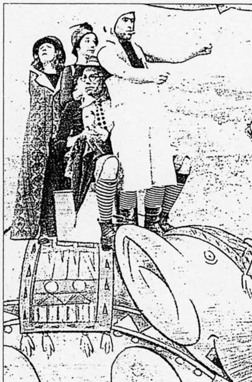
Los cuatro protagonistas del espectáculo.