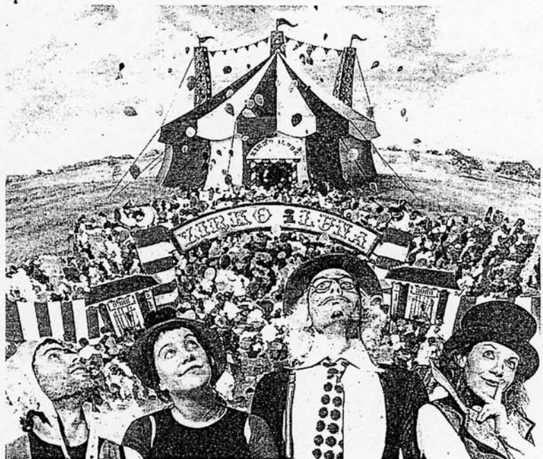
Imagen promocional de Hortzmuga en 'Zirko Illuna'.

Muchas cosas, aunque depende del estado de ánimo del espectador. Me refiero a que habrá gente que simplemente quiera divertirse y otra que saque jugo al mensaje que pretendemos transmitir. Siempre intentamos que haya partes bonitas, de las que se puedan desprender valores y sentimientos.