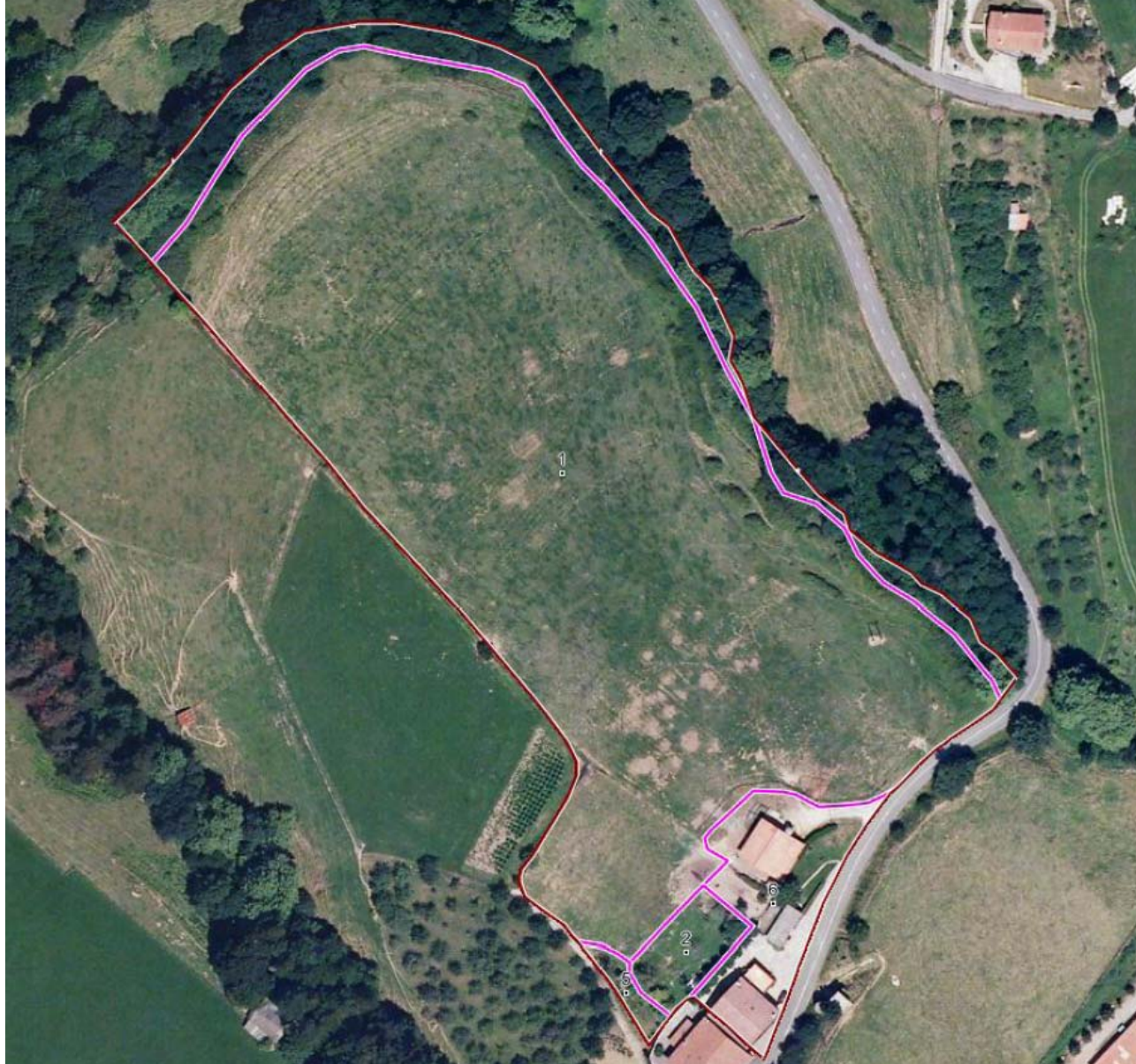
Fig. 02. Imagen del SIGPAC con los recintos de la parcela 12.

En la figura 02 obtenida del SIGPAC se indica la situación de los recintos de la parcela 12 y en la figura 03 obtenida del SIGPAC se indica la situación de los recintos de la parcela 14.