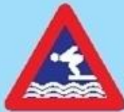
Figura 1: ESQUEMA DE LOS RIESGOS ASOCIADOS A LAS DIVERSAS ZONAS DE UNA PISCINA