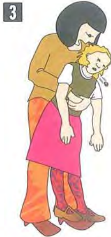
Mutil edo neska koskorra: