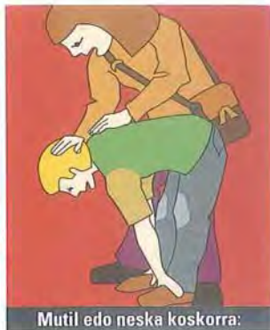
Mutil edo neska koskorra: