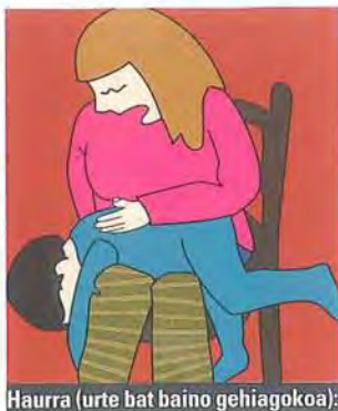
Haurra (urte bat baino gehiagokoa):