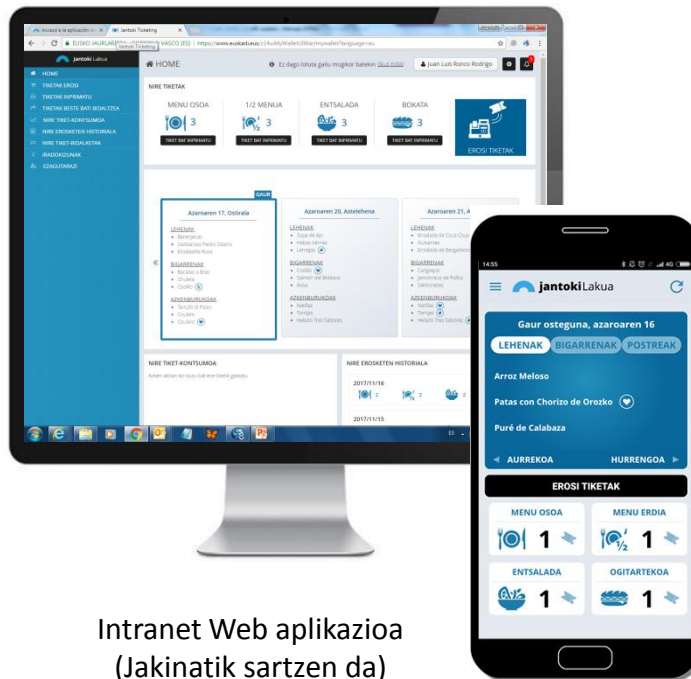
Intranet Web aplikazioa (Jakinatik sartzen da)

Erabiltzaile-mota bakoitzak erabil ditzakeen aplikazioak: