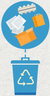
Papel y cartón

Si quieres realizar un consumo responsable, deposita cada residuo en su contenedor