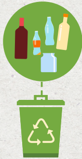
Vidrio (no cristales)