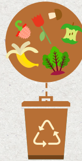
Compostaje Residuos de origen orgánico*