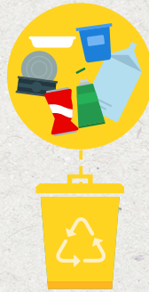
Envases de plástico, latas y bricks