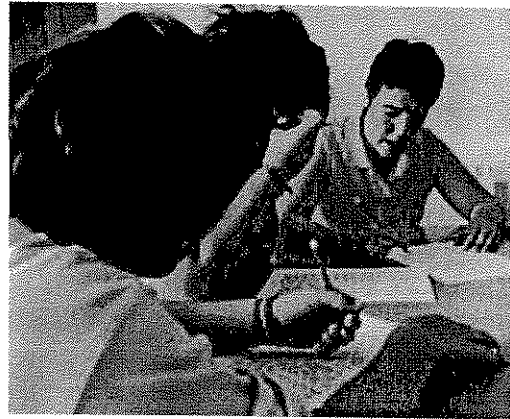
Gazteak euskara ikasten.

Irisasin dauden gaztetxo gehienak familia hondatutatik datoz: «Gazteek sozializatzeko arazoak izaten dituzte. Batzuek arazo psikologiko edo psikiatrikoak, eta beste batzuek portaera arazo larriak, besterik gabe. Seguru asko haurtzaro egokia izan ez dutelako sortu dira; adibidez, batzuk ez dira eskolara joan. Gure kasuan, familia hautsitatik datoz asko: gurasa-ak alkoholikoak dira edo drogaren menpe daude, edo desoreka psikologikoa dute». Irisasitik ahalgintzen dira familiei ere laguntzen: «Tratamendu beharrean dauden