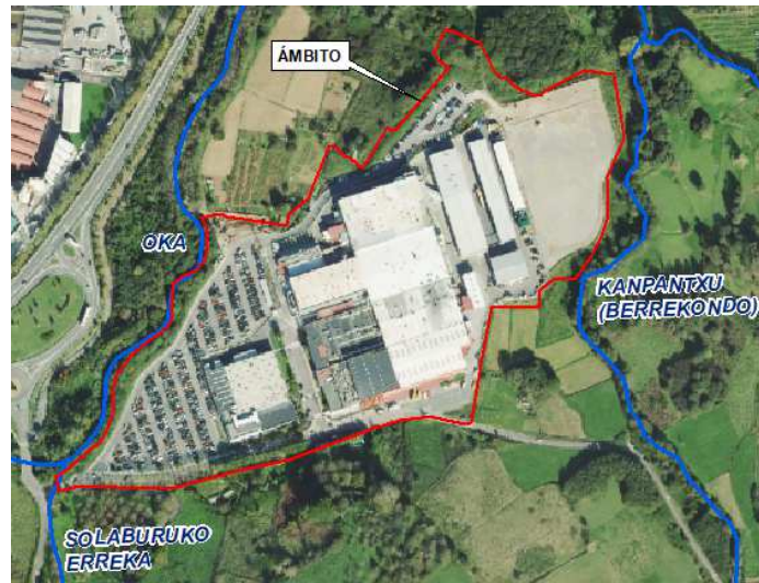
Ilustración 1.- Red hidrográfica del ámbito.

El ámbito de la modificación puntual del PGOU de Ajangiz se localiza dentro de las zonas de policía de los cauces Oka, Kanpantxu y Solaburuko karkabea. También se verá afectado el DPH y la zona de servidumbre de este último por las obras de mejora del acceso.