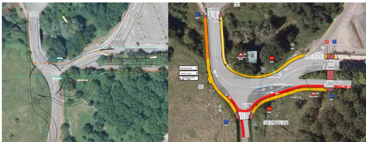
Ilustración 3.- Alternativa 2.1: nueva rotonda (imagen izquierda), Alternativa 2.2: ampliación enlace actual (imagen derecha).

En el marco de la tramitación ambiental de la modificación puntual se analizaron 3 alternativas, seleccionándose la Alternativa 2 (ampliación de la edificabilidad y mejora del acceso). En relación con la mejora del acceso, se han analizado 2 alternativas (ver ilustración 3) siendo seleccionada la Alternativa 2.2 que amplía el acceso existente en la actualidad, debido principalmente a que implica una menor ocupación y afección del suelo no urbanizable.