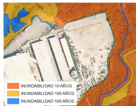
Ilustración 2.- Riesgo de inundación en el entorno del arroyo Berrekondo.

No obstante, la cota de los rellenos que conforman la plataforma existente en la margen izquierda del arroyo Berrekondo se sitúa por encima de la cota inundable, aspecto que se puede observar en la ilustración 2.