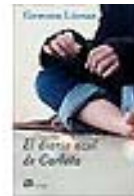
El diario azul de Carlota Genma Lienas (El Aleph)

Un libro situado entre la ficción y la no ficción que trata todas las formas de violencia que sin duda deberán enfrentarse las chicas adolescentes y ofrece recursos para reaccionar adecuadamente en situaciones de peligro