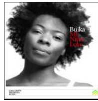
Mi niña Lola / Buika (Dro)

Buika combina el ritmo africano y su sentido primitivo del arte con la armonía y modernidad del Jazz más vanguardista