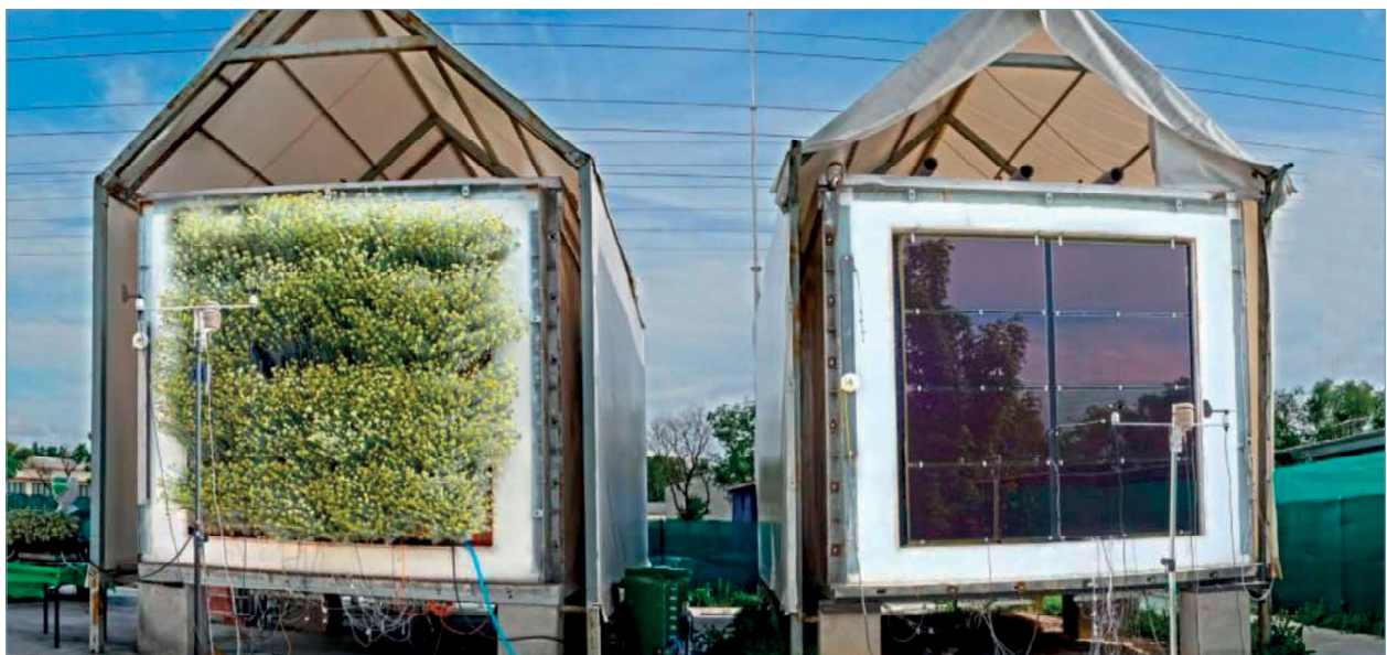
Ensayos de cerramientos en condiciones climáticas reales, realizados dentro de la red europea DYNASTEE y las especificaciones PASLINK test. Laboratorio de Control de Calidad en la Edificación del Gobierno Vasco

Como conclusión, el control de calidad debe adaptarse a las nuevas exigencias energéticas de los EECN. Por un lado, debemos ser conscientes de la utilidad del Control Externo del CEE y por otro lado, será imprescindible la realización de verificaciones complementarias en todas las etapas del proceso de edificación: en el proyecto de ejecución, en la ejecución de la obra y al final, como pruebas finales y pruebas de servicio.