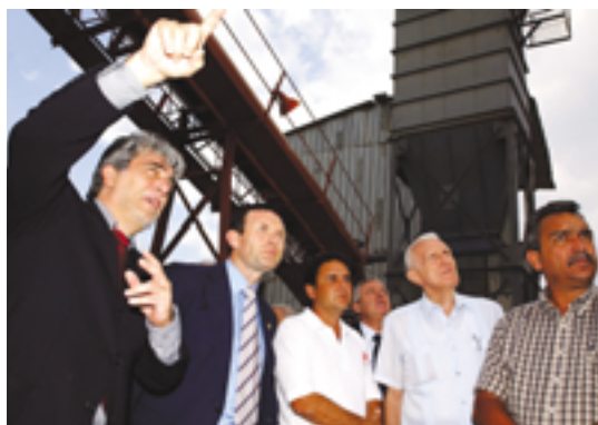
Visita a un proyecto de cooperación al desarrollo.