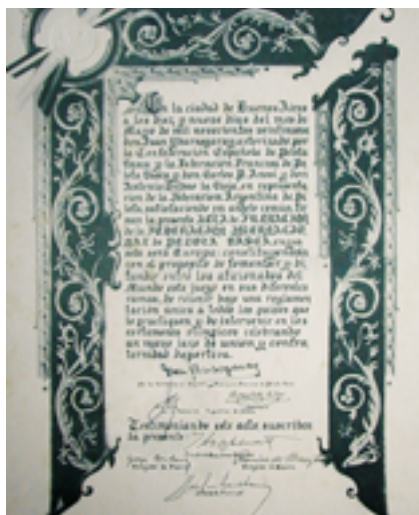
Protocolo de Buenos Aires.

En este sentido, la Federación de Pelota Vasca de Euskadi, para conocer el interés real por la participación internacional de la Selección Vasca, realizó una encuesta entre sus pelotaris, jueces y clubes afiliados, formulando tres preguntas al respecto, obteniendo un evidente resultado favorable a la participación de la selección vasca, tal y como muestran los resultados que a continuación se presentan: