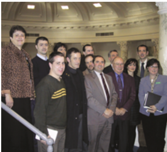
Foto de familia de impulsores e invitados, tras la votación.

sa en 1998. Vasco de tercera generación, habla perfectamente euskera al igual que sus cuatro hermanos.