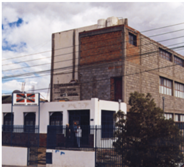
Centro Vasco de Comodoro Rivadavia, Provincia de Chubut.

Desde estas páginas nuestros mejores augurios de que esta situación se supere a la mayor brevedad posible. ■