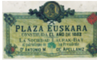
Placa conmemorativa en el Centro Vasco Laurak Bat.

Si tuvieras oportunidad de participar en un campeonato del mundo, ¿en representación de qué selección te gustaría tomar parte, siendo las dos oficiales y del mismo nivel?