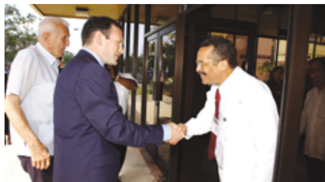
En compañía del Vicepresidente Hernández, visita a una escuela de trabajadores sociales y a un centro de biotecnología.

ciación y asesoramiento jurídico en un país cuyo entramado económico es tan complejo y burocrático. Ibarretxe les prometió que su Gobierno dará pasos concretos para solucionar ese problema y aseguró que "los empresarios vascos no son aves de paso que sólo buscan descapitalizar el país sino que por el contrario, están en Cuba para comprometerse con su futuro". El presidente de la patronal vasca, por su parte, agradeció al Gobierno Vasco su apoyo y animó a los empresarios a continuar invirtiendo sobre todo de cara al futuro.