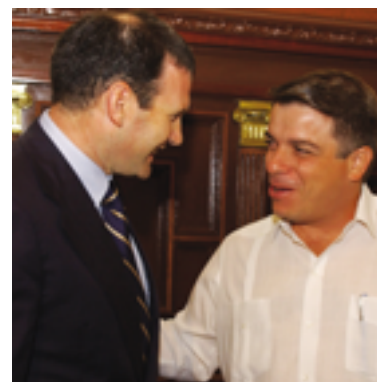
Con el Ministro de Exteriores, Felipe Pérez Roque.