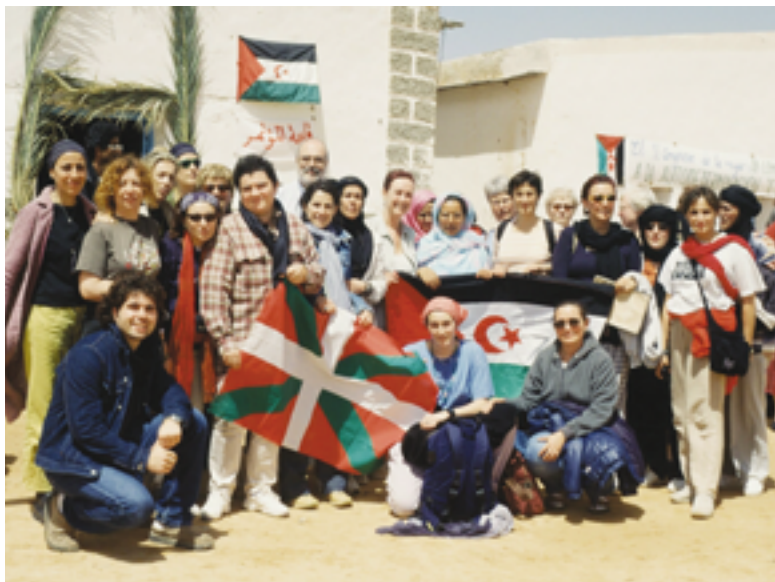
Integrantes de la delegación vasca en el Congreso.