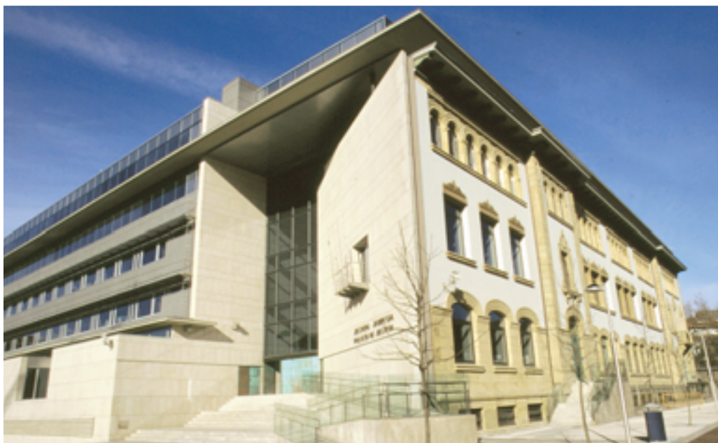
Nuevo Palacio de Justicia en Atotxa, Donostia-San Sebastián.

Además, los foros JustiziaNET abren la posibilidad de que los visitantes puedan hacer sus aportaciones