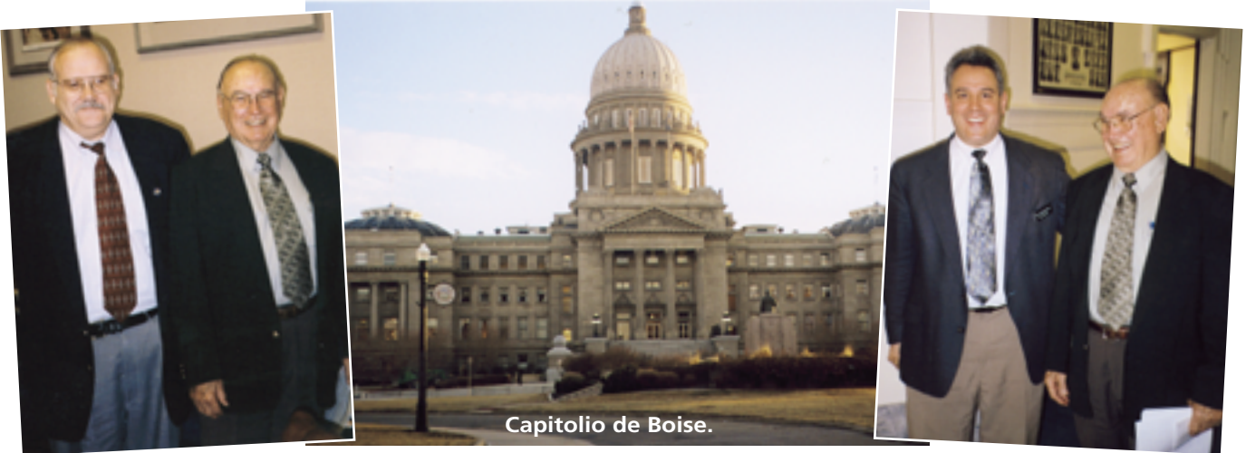
Capitolio de Boise.