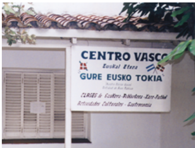
Centro Vasco de Moreno, en la Provincia de Buenos Aires.