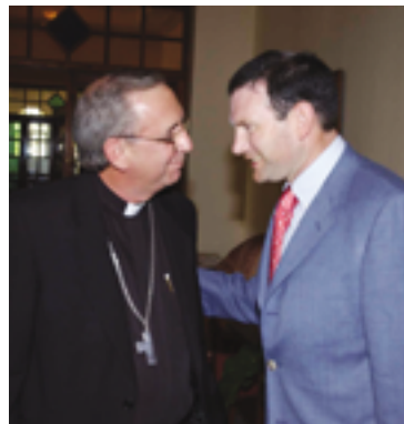
Con Monseñor Aranguren, Obispo de Cienfuegos.

Pese a ello, y durante la cena que los empresarios vascos establecidos en Cuba tuvieron una de las noches con el Lehendakari, le transmitieron la necesidad de que el Gobierno vasco les apoye con finan-