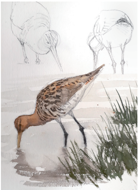
Ilustrazioa: Xabier Mendarte

Ikastaroaren helburua natura-marrazkiko hastapenerako oinarrizko aholkuak ematea da, hegaztien batez ere. Saio praktikoaren bitartez, beharrezko materialak erabiltzen, zirriborroak egiten eta kolorearekiko eta argiarekiko erlazioan duten teknikak erabiltzen ikasiko dugu.