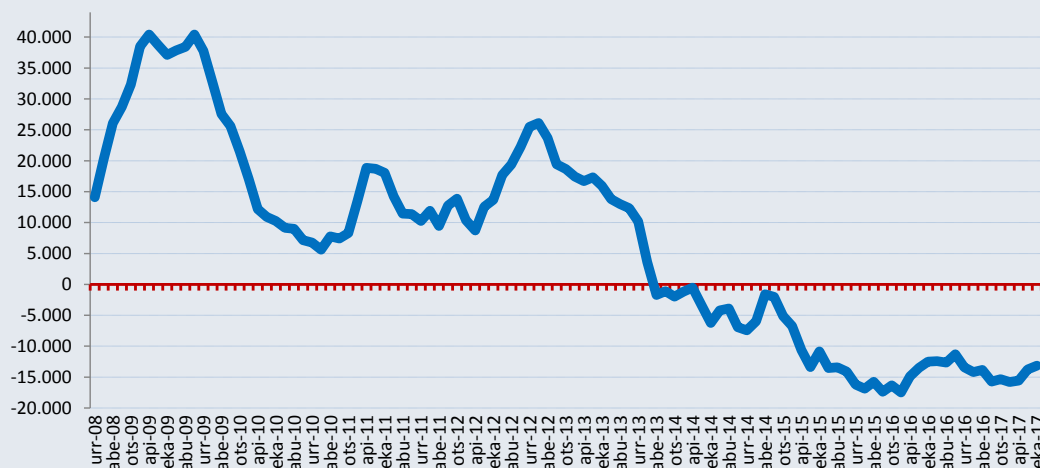
Erregistratutako langabetuen urte arteko saldoaren bilakaera

Ekaineko langabeziaren eboluzioaren portaera honek urte arteko saldoaren erritmoan du isla, 10.592 pertsonetan murrizten da, aurreko hilabeteen baino 2.564 pertsona gutxiago.